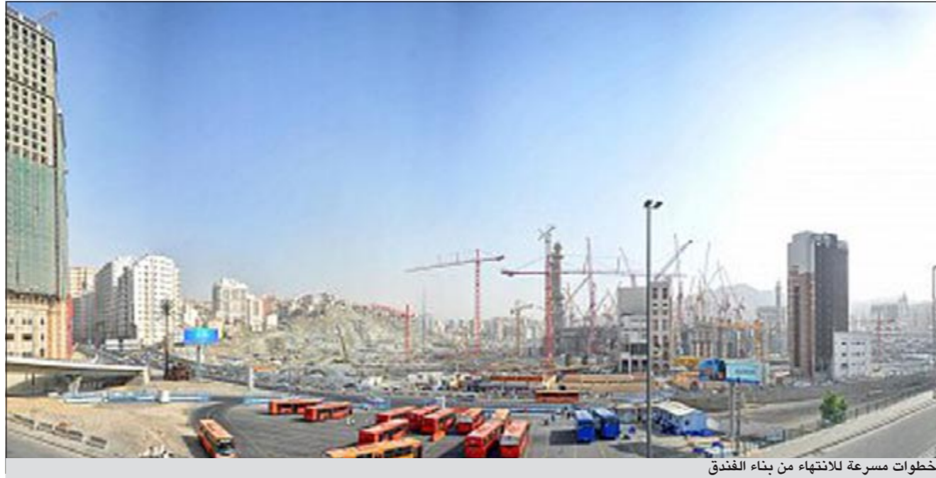
خطوات مسرعة للانتهاء من بناء الفندق