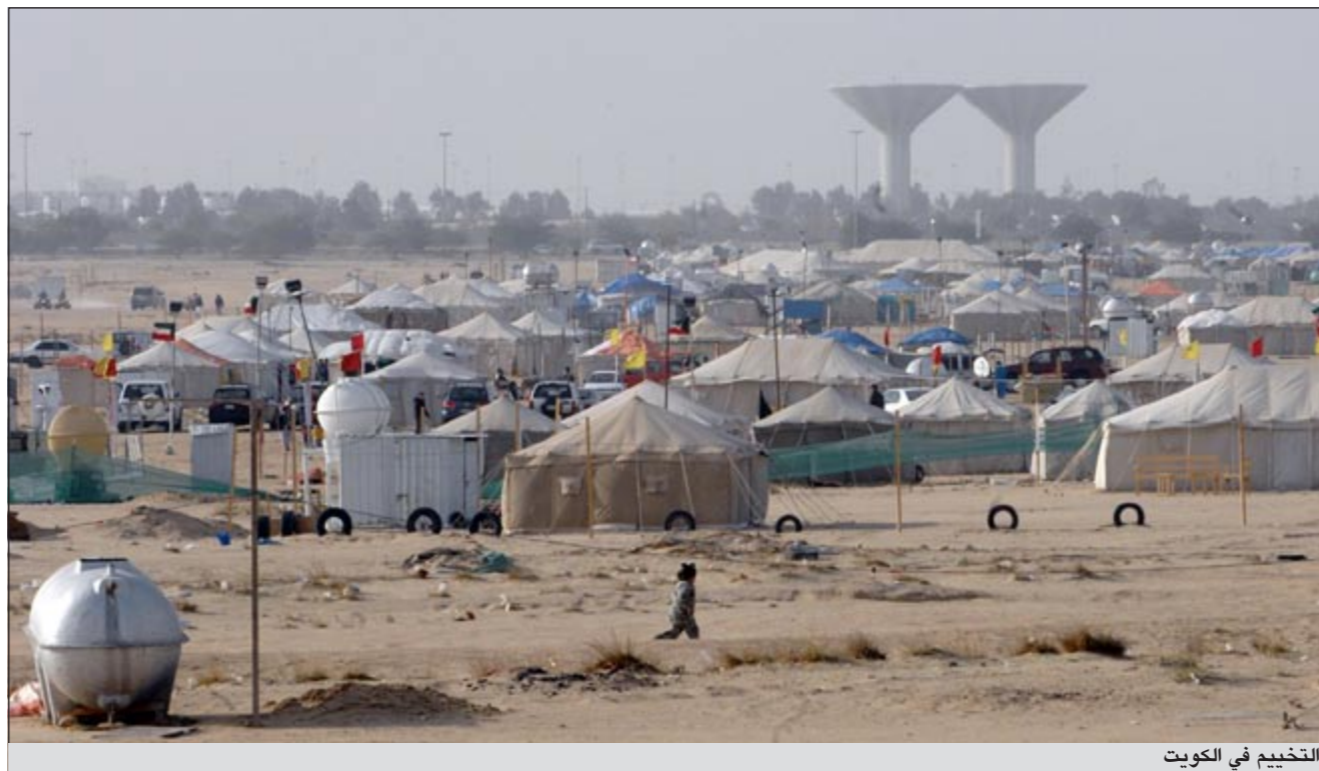
التخيم في الكويت

أخوانهم البدو ويتقلون إلى الصحراء للاستمتاع بقضاء أربعة أشهر فيها ضمن خيام الشعر السوداء من جديد ويتشارك الجمع في هذه الهجرة الربيعية من المدينة وفي الاستمتاع بنتائجها الصحية والمفيدة..