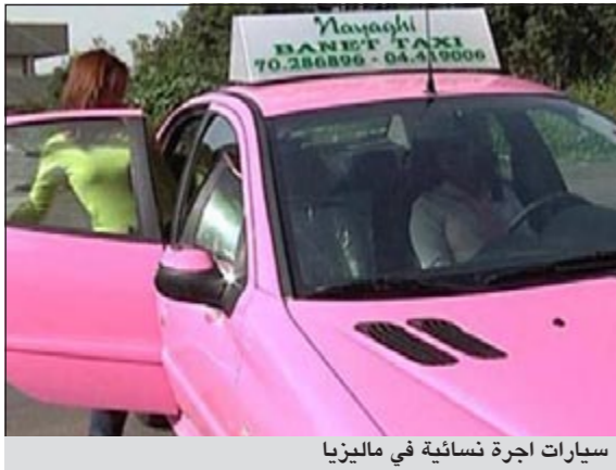
سيارات أجرة نسائية في ماليزيا

دبي - العربية: أطلقت ماليزيا أسطولاً من سيارات الأجرة تقودها نساء ومخصصة لهن في مبادرة تأتي بعد القطارات والحافلات الزهرية الهادفة التي حماية المرأة من التحرش والمضايقات حسب ما أفادت تقارير صحافية أمس.