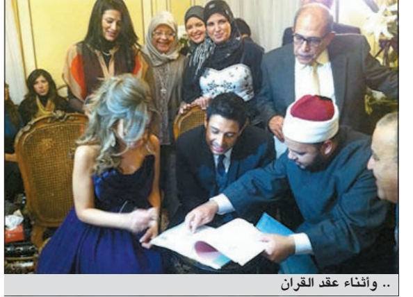
.. وإثناء عقد القران

على رغم السرية التي فرضها الفنان الشاب محمد حماقي على صور عقد قرانه على خطيبته نهلة، إلا أن موقع «أنا زهرة» نشر الصور الأولى لهذه المناسبة العائلية.