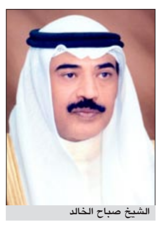
الشيخ صباح الخالد

عراق لم يلتزم حتى الآن بإكمال صيانة العلامات الحدودية وتامل من الأمانة العامة دعوته للإسراع في ذلك الكويت تؤيد استمرار تراسوف في مهمته كمنسق دولي رفيع لشؤون الأسرى والمفقودين لضمان تنفيذ قرارات المجلس ذات الصلة