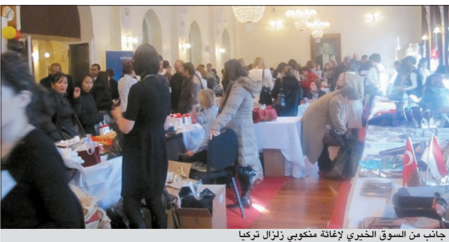
جانب من السوق الخيري لإغاثة منكوبي زلزال تركيا

أنقرة - كونا: شاركت سفارتنا لدى أنقرة امس في معرض خيري أقيم لصالح إغاثة المنكوبين في كارثة الزلازل التي ضربت شرقي تركيا الشهر الماضي وخلفت حوالي 650 قتيلا وأكثر من 2150 جريحا. وأقامت السفارة الكويتية جناحا لها في المعرض الذي نظمه اتحاد العاملين في وزارة الخارجية التركية بمقر الوزارة في أنقرة واشتمل على عرض مجموعة متنوعة من المشغولات اليدوية والحرفية والملبوسات والمأكولات التي تعكس التراث الكويتي والهوية الوطنية. وأشرف على جناح الكويت في المعرض الخيري عقيلة عميد السلك الديبلوماسي سفيرنا عائشة المدفع بمشاركة زوجات الدبلوماسيين الكويتيين والعاملين بالسفارة الكويتية في أنقرة، وقالت المدفع لـ «كونا» إن المشاركة الكويتية في المعرض جاءت انطلاقا من الإيمان بأهمية العمل الخيري في تخفيف معاناة المحتاجين والمتضررين من