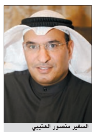
السفير منصور العتيبي

لذلك تؤيد الكويت استمرار ولاية المنسق الدولي رفيع المستوى السفير غينادي تراسوف لضمان تنفيذ قرارات مجلس الأمن ذات الصلة، وتامل من أعضاء مجلس الامن دعم استمرار ولايته من أجل تحقيق نتائج جوهرية تساعد على اغلاق هذا الملف الإنساني. صيانة العلامات الحدودية: من الالتزامات الرئيسية التي نص عليها قرار مجلس الامن 833 (1993) ولم تجد طريقها الى التنفيذ، هو مشروع صيانة العلامات الحدودية بين البلدين، الفنية المنبثقة عنها برئاسة اللجنة الدولية للصليب الأحمر للكشف عن مصير المفقودين وغيرهم من رعايا الدول الثالثة. وتامل أن يتواصل ويستمر هذا التعاون ويتم تكليفه في إطار اللجنة الثلاثية واللجنة الفنية المشتركة منها برئاسة اللجنة الدولية للصليب الأحمر للتحقق عن مسير المفقودين والتكثيف وغيرهم من رعايا الدول الثالثة.