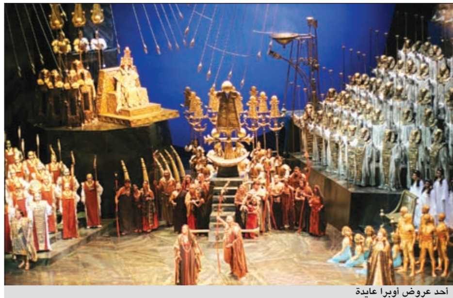
أحد عروض أوبرا عايدة

متحف دار الأوبرا بباريس وكان من بينها التصميمات الأصلية لأزياء وديكور ومناظر هذا