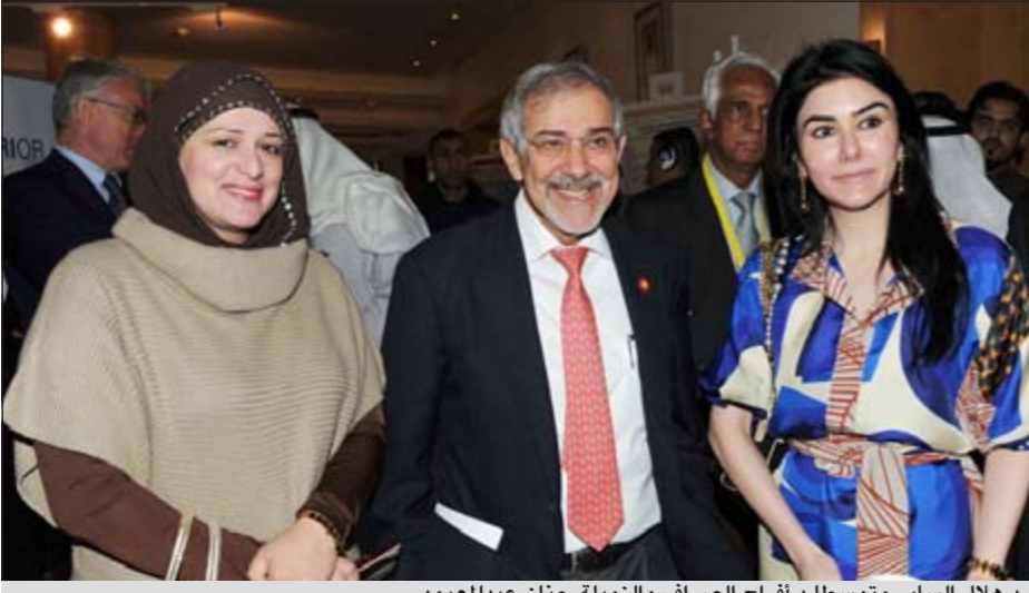
د.هلال الساير متوسطا د.أفراح الصراف والزيميلة حنان عبدالمعبود

أكد وزير الصحة د.هلال الساير أن مشكلة السمنة أصبحت عالمية وليست في الكويت فقط، مبيناً أن مضاعفاتها كثيرة وأولها على جهاز الدورة الدموية والقلب والأصابة بالجلطات الدماغية، منوهاً عن بعض العمليات التي تعالج السمنة المفرطة تساعد أيضاً في علاج السكر، وأشار إلى أن من يعاني من سمنة مفرطة معرض للإصابة بمرض السكر وأمراض السرطان. جاء هذا خلال تصريح لوزير الصحة على هامش افتتاحه صباح أمس المؤتمر الكويتي السنوي الأول لجراحة السمنة، والذي عقد بقاعة الشيخة سلوى بمارينا، بحضور حاشد خبراء ومتخصصين عالميين، وأطباء محليين، وقال د.الساير «أن هذا المؤتمر تم تنظيمه للتقدم خطوات للأمام في علاج السكر والسمنة المفرطة بالكويت، مضافاً أن المؤتمر يشهد حضور ضيوف من أغلب بلدان العالم لمناقشة مشكلة السمنة. وكان الوزير ألقى كلمة افتتاحية للمؤتمر أكد فيها أن هذا المؤتمر يعد من اللقاءات العلمية الهامة التي تتبع الفرصة للمتخصصين لتبادل الخبرات في مجال جراحة السمنة والإطلاع على أحدث المستجدات لمواجهة هذا الوباء الجديد الذي يتزايد انتشاره في مختلف دول العالم بسبب أنماط الحياة الحديثة والسلوكيات والعادات غير الصحية، وقال «إن الزيادة المطردة بمعدل انتشار السمنة وزيادة الوزن أصبحت إحدى التحديات التي تواجه نظم الرعاية الصحية بمختلف دول العالم وتتوفر على تحقيق الأهداف الإنمائية للألفية»، مضيفاً أن إرادة قادة ورؤساء دول العالم قد اجتمعت على أهمية التصدي للسمنة وغيرها من الأمراض المزمنة غير المعدية وعوامل الخطورة ذات العلاقة بها مثل