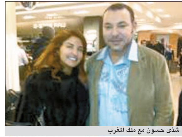
شذى حسون مع ملك المغرب

أثار انتشار صورة للفنانة العراقية شذى حسون مع ملك المغرب محمد السادس استياء عدد من المغاربة الذين اعتبروا أنها تخلت عن مغربيتها، وأنهم لا يقفون بها لأنها لا تفخر بهم ولا بلهجتهم، وتم إدراجها على صفحة «لا تفخر بمن لا يفخر ببلهجتنا»، وكتب تعليقاً على صورتها مع الملك، بحسب ما ذكر موقع «أنا زهرة»: «هذه النكارة لجميل المغرب، هل تستحق هذه الصورة؟ وهل يا ترى يعرف ملكنا أنها تنكرت للمغرب ليعطيها وقتاً»، وابتدوا رسالة إلى شذى ناكرة لجميل المغرب عليها حالما دخلت «ستار أكاديمي»، وأن المغاربة هم الذين صوتوا لها حتى وصلت إلى التصفيات النهائية ونالت اللقب.