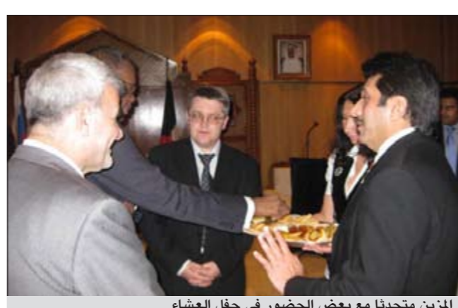
السفير ناصر المزين

وأكد المزين تميز العلاقات العربية - الروسية بجذورها التاريخية الممتدة منذ عقود بعيدة، مشدداً على أهمية الارتقاء بهذه الروابط في مختلف المجالات خاصة الأكاديمية والبحثية والإعلامية. ودعا المزين الإعلاميين إلى توخي الموضوعية في نقل الكلمة والصورة خاصة في هذه المرحلة