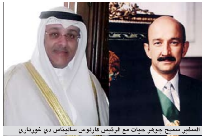
السفير سميح جابر مع الرئيس كارلوس ساليناس دي غورتاري

سأهت في تحرير الكويت وعودة الشرعية إليها. وأوضح ان تلك الزيارة