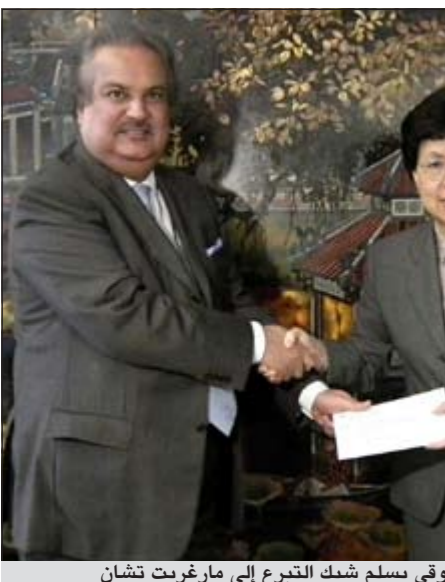
السفير ضرار رزوقي يسلم شيك التبرع إلى مارغريت تشان

تؤدي المناعة ضد الأدوية إلى ارتفاع تكاليف الأبحاث للوصول إلى علاج فعال ومن ثم ارتفاع تكاليف العلاج فضلاً عن تفشي المرض. وقال السفير رزوقي ان تلك المشروعات التي تساهم الكويت في تمويلها تصب في صالح الدول العربية والإسلامية بل ودول أخرى أيضاً فضلاً عن تكامل تلك البرامج مع برامج تنموية أخرى تقوم بها منظمات ذات صلة. وأشار إلى مشروعات أخرى