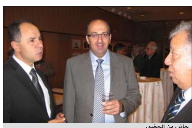
المزين متحدثاً مع بعض الحضور في حفل العشاء