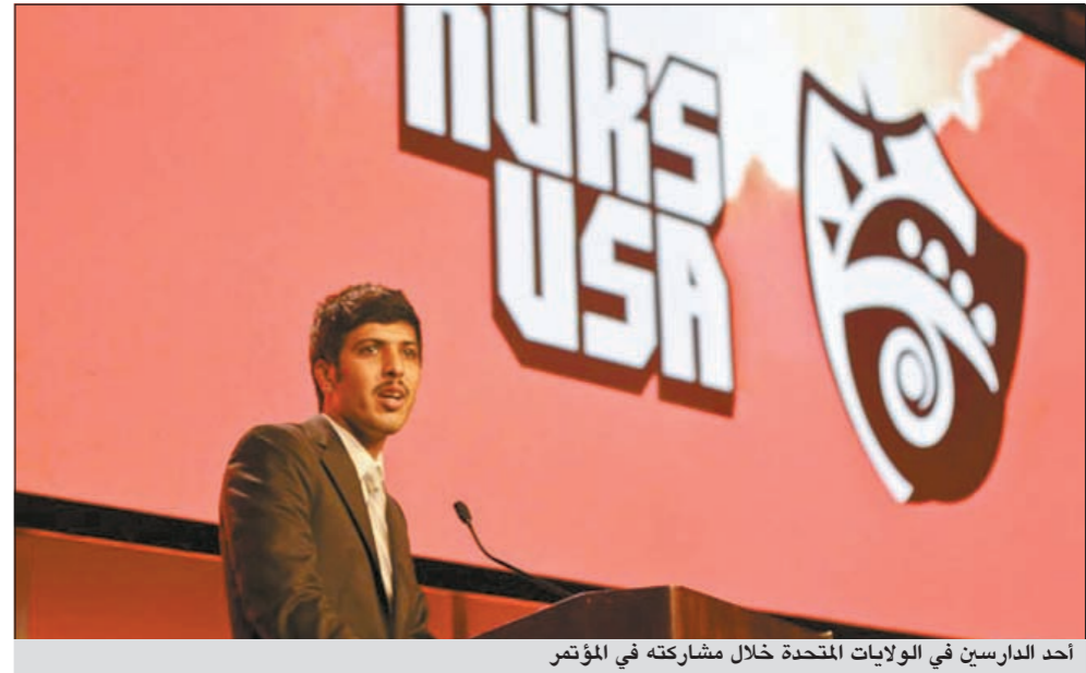
أحد الدارسين في الولايات المتحدة خلال مشاركته في المؤتمر

العبدالله: 2000 طالب يشاركون في المؤتمر بعد أن كانوا 200 فقط قبل 10 سنوات نفخر برؤية نماذج مشرقة من أبناء الكويت سيحملون على عاتقهم مسؤولية إعلاء راية وطنهم