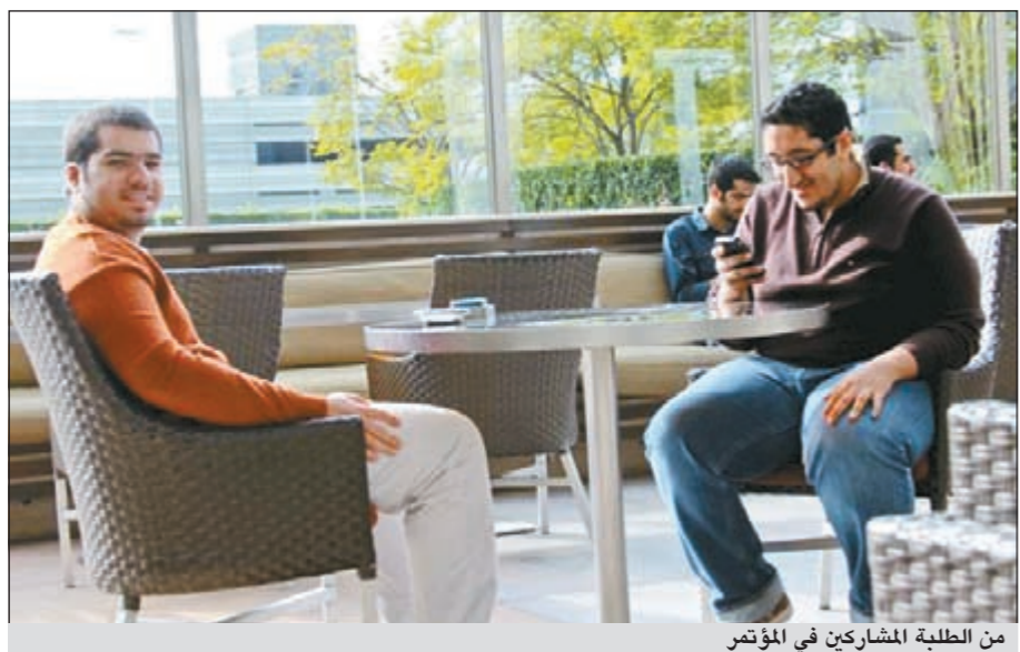
من الطلبة المشاركين في المؤتمر