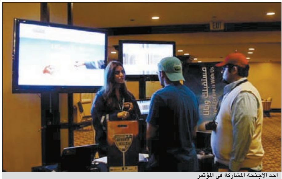
أحد الإيجحة المشاركة في المؤتمر

أكد الرئيس التنفيذي مؤسسة البترول الكويتية فاروق الزنكي أن القطاع النفطي الكويتي باعتباره المحرك الرئيسي للاقتصاد في دولة الكويت يهدف إلى خلق فرص وظيفية جديدة للشباب الكويتي، مؤكداً أن التقديرات الأولية تشير إلى حاجة القطاع النفطي في الكويت إلى أكثر من (8300) فرصة وظيفية خلال الخطة الخمسية للسنوات 2011/2012 - 2015/2016 لمواجهة الاحتياجات المتزايدة من العمالة اللازمة لمقابلة التوسعات المستقبلية وزيادة المضطرة في القدرة التشغيلية المتوقعة خلال السنوات القادمة. جاء ذلك في كلمة خاصة في حفل افتتاح مؤتمر الاتحاد السنوي الثامن والعشرين لطلبة الكويت في الولايات المتحدة الأميركية المقام