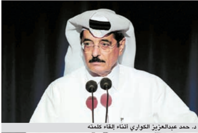
د. حمد عبدالعزيز الكواري أثناء إلقاء كلمته

اما عضو لجنة الأمانة ربيعة الكواري، فقال: «الجائزة تحظى برعاية من وزارة الثقافة والفنون والتراث متمثلة بخص وزير الثقافة د.محمد بن عبدالعزيز الكواري الذي أعطى للجائزة كل الاهتمام لخدمة أدب الطفل». وأضاف: لقد شهدت الجائزة تطورا نوعيا يواكب التقنيات العلمية ويواكب المنتج الثقافي للطفل، مشيراً إلى أن الجائزة ستركز على الأعمال المستوحاة من التراث بما يساعد الأجيال بربطها بالمتصل الحضاري والإسلامي.