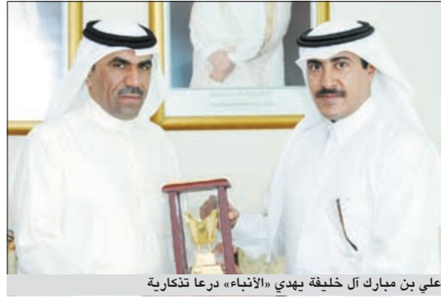
علي بن مبارك آل خليفة يهدي «الأنباء» درعا تذكارية

والمعرفة في حياة الطفل. ومن الترات د.محمد عبدالعزيز الكواري كلمة عبر فيها عن شكره وتقديره لراعي نبضة قطر الثقافية صاحب السمو الشيخ حمد بن خليفة آل ثاني أمير دولة قطر الشقيقة، الذي رسم أبعاد العملية الحضارية، كما بدأ جلياً في رؤية قطر الوطنية، ولسمو الشيخ تميم بن حمد آل ثاني، لدعوه للمبدعين والشباب والطفولة، ولصاحبة المبادرة في استحداث جائزة الطفل صاحبة السمو الشقيقة موزة بنت ناصر.