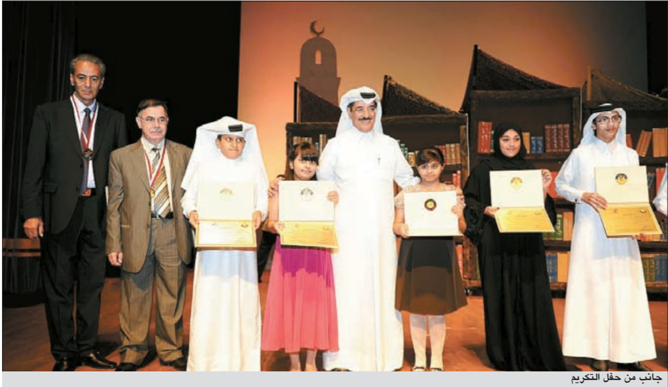
جانبا من حفل التكريم