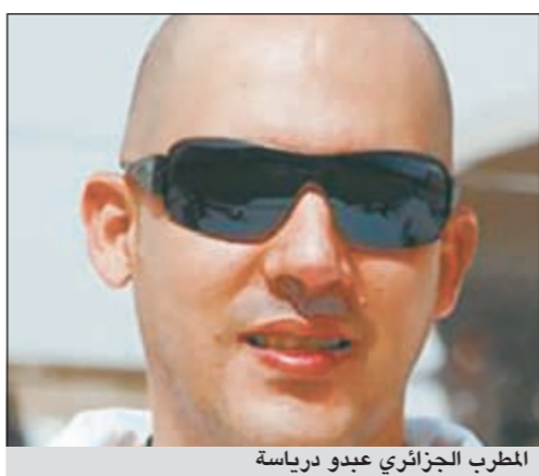
المطرب الجزائري عبدو درياسة

كشف المطرب الجزائري عبدو درياسة أن أغنيته التي أطلقها احتفاءً بالثورة التونسية ما زالت ممنوعة من العرض في تونس حتى الآن، دون الكشف عن أسباب ذلك. ونفى درياسة - في تصريح لموقع mbc.net أن يكون قد تخلى عن الأغنية التي كشف عنها لتمجيد الثورة التونسية، وقال: «لا ليس صحيحاً أن الأغنية لم تر النور.. بل تم تسجيلها ووضع في الإذاعة التونسية لكنها لم تبق ولم تذاق، وكانت حجتها في ذلك أنه لا يمكن الغناء عن الثورة طوال الوقت». وقمنا بتغني بتوجهه إلى اللهجة الخليجية، قال درياسة: «كنت أعني الخليجي كلما ذهبت إلى الخليج لإحياء الحفلات، لكنها أول أغنية أسجلها وأكتبها وأحفظها وأطرحها في الألبوم، وعنوانها «شلونك» وأتمنى أن تلقى النجاح».