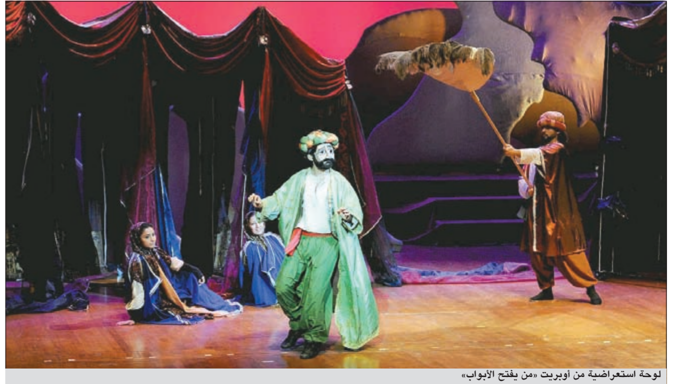
لوحة استعراضية من أوبريت «من يفتح الأبواب»

توزيع جائزة قطر لأدب الطفل بحضور خليجي وعربي