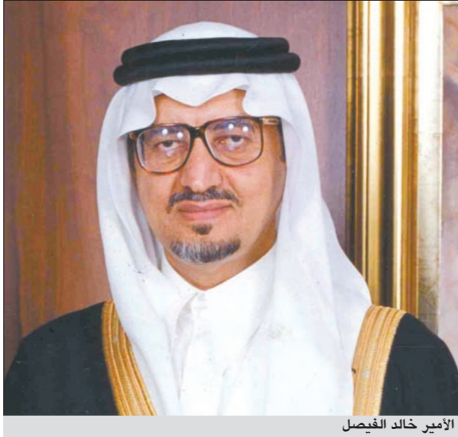
الأمير خالد الفيصل