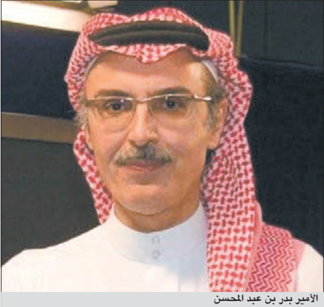
الأمير بدر بن عبد المحسن

● حبسك الله واتمنى أن تكون إجاباتي وافية وكافية وأنا في النهاية أشكر الكويت التي احتضنتني في بداياتي وتحضنتني الآن من خلال تكريم المجلس الوطني للثقافة والفنون والآداب لي في مهرجان الفنون الموسيقية وكل الشكر للفنانين الكويتيين والجمهور الذين عمروني بحبهم.