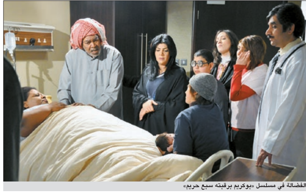
الفضالة في مسلسل «بوكريم برفقته سبع حريم»

تمنت الفنانة نانسي عجرم خلال احيائها الحفل الاخير في دبي في مدينة جميرا ان تصدر في يوم من الايام اغنية باللغة الهندية بعد ان عبرت عن اعجابها باللغة. كلام نانسي جاء خلال حوار خاص معها لبرنامج «هاي لايف دبي» الذي يعرض على شبكة «سوني انترتينمنت تي في». يذكر ان برنامج «هاي لايف دبي» قد استضاف عددا من مشاهير العالمين العربي والغربي ونجوم بوليوود بشكل خاص.