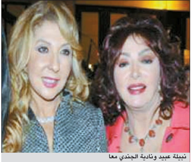
نبيلة عبيد ونادية الجندي معا

على الرغم من العداء الشديد المشهور عنهما في الوسط الفني منذ سنوات طويلة بسبب اتهام كل منهما الاخرى بأنها تكيد لها بأعمال السحر والشعوذة، إضافة إلى منافسة كل منهما في جذب أكبر عدد من الجمهور، فإن الفنانين نبيلة عبيد ونادية الجندي ظهرتا أخيراً في حفل عرض أزياء لمصمم الأزياء المصري هاني البحيري. وتداولت المواقع الفنية، بحسب «دنيا الوطن»، صورة النجمتين نبيلة عبيد ونادية الجندي، وقد ظهرت على كل منهما ملامح كبر السن، حيث يبدو أن كلا منهما تجاوزت