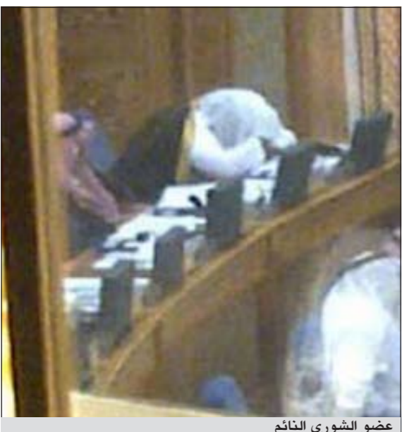
عضو الشورى النائم

ضبطت عدسة هاتف جوال عضوا في مجلس الشورى السعودي وهو نائم، خلال مناقشة المجلس نظام الرعاية الصحية التأسيسية في جلسة أول من امس.