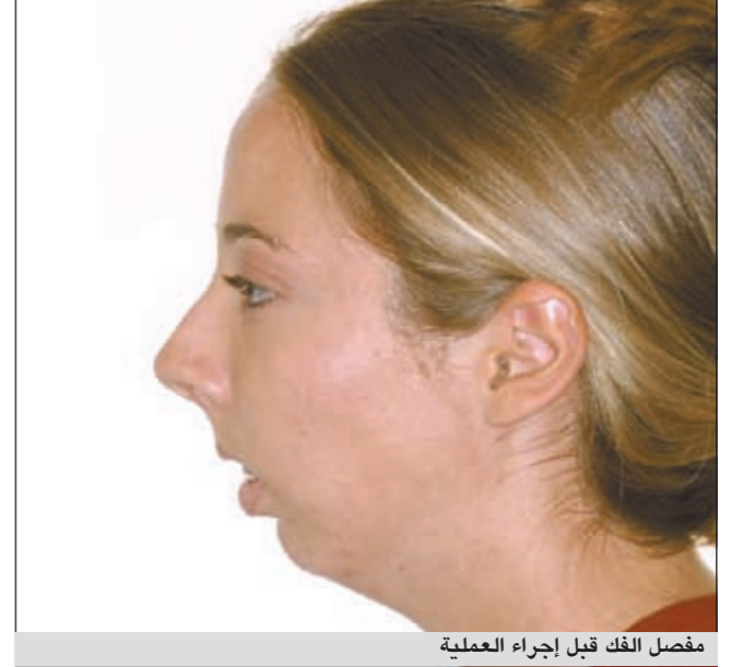
مفصل الفك قبل إجراء العملية