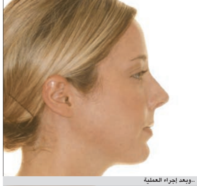
..وبعد إجراء العملية