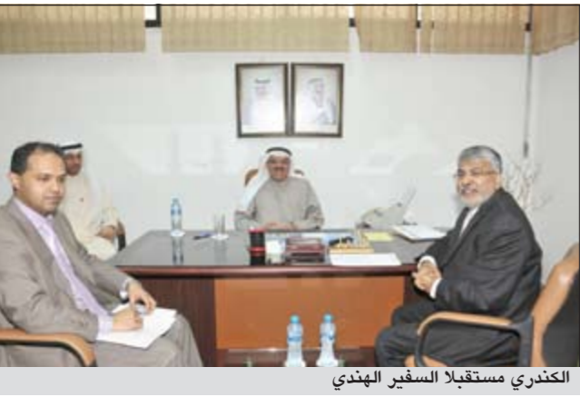
الكندري يستقبل السفير الهندي

جاء ذلك خلال استقبال الوكيل لسفير الجمهورية الهندية سانيش ميهيتا حيث تم التطرق خلال الاجتماع الى مناقشة بعض الملاحظات التي قدمها السفير بشأن جلب العمالة وتشغيلها وما يصادف بعضها من مشكلات سواء في السكن او الرواتب وظروف العمل وابدى الوكيل