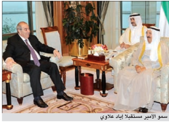
سمو الأمير استقبلا ابياد علاوي