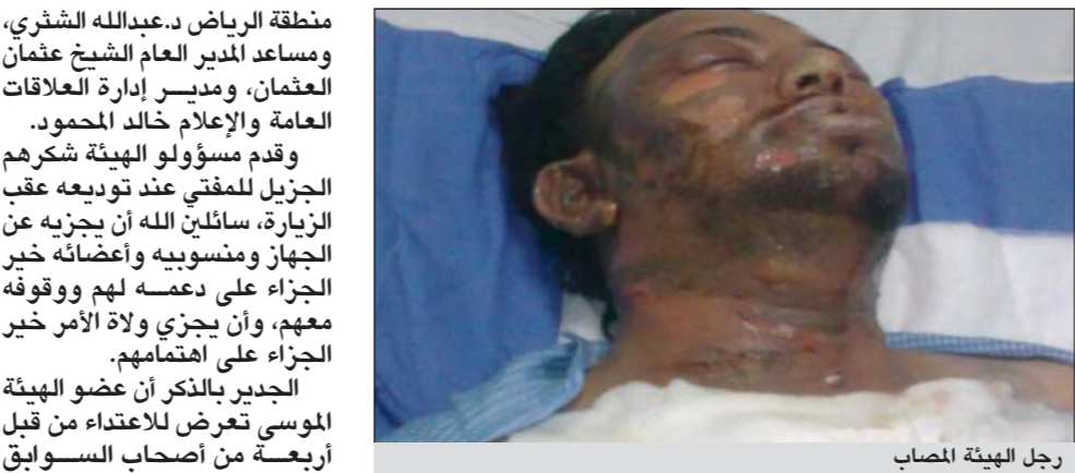
رجل الهيئة المصاب