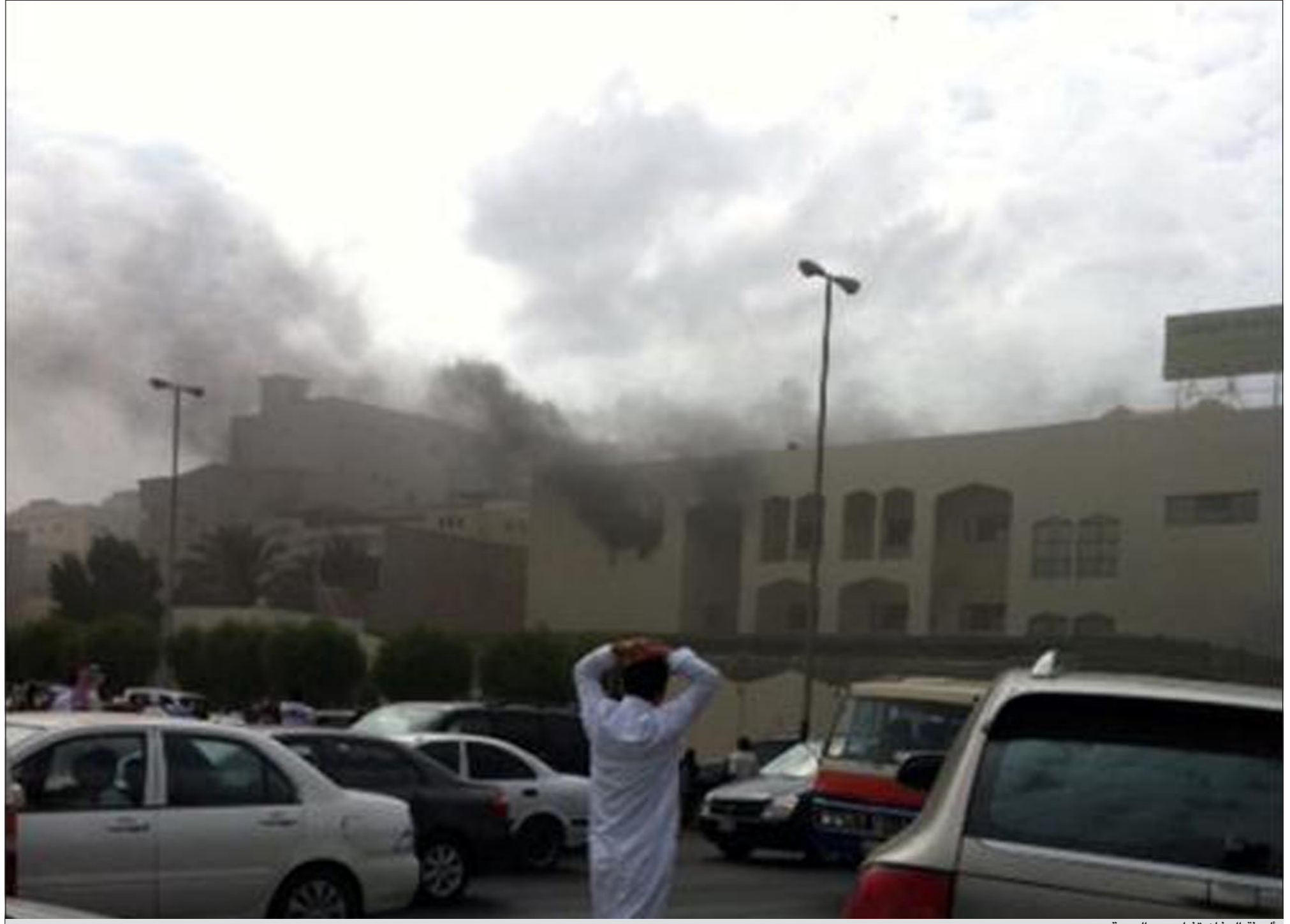
السنة الدخان تندلع بعد الحريق

الجفون اكفاننا والحنوط من الكبود ليتنا كنا الفدى بالجلود وباللحم