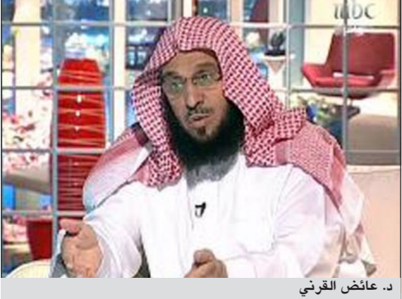
د. عائض القرني

القرني معزياً «شهداء البراعم» بقصيدة: أين حمام حمى البيت؟