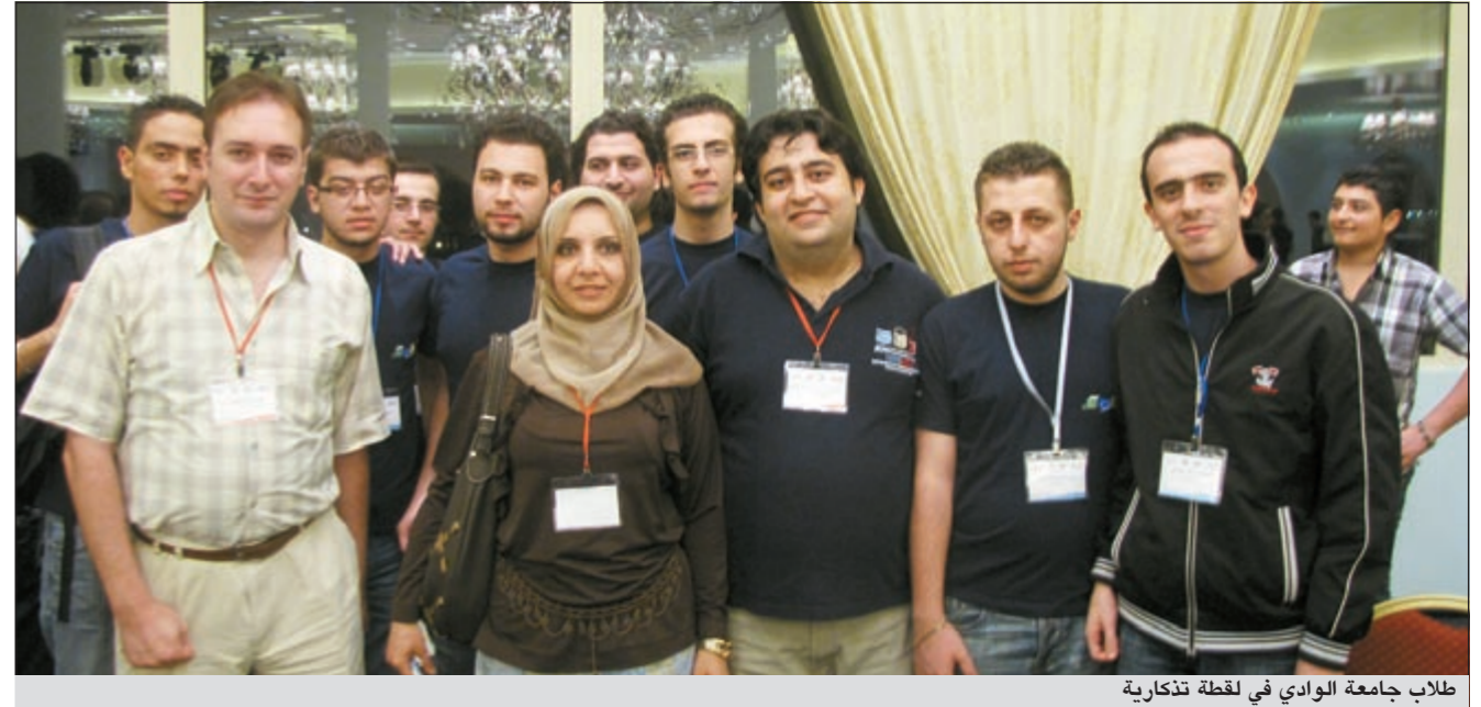
طلاب جامعة الوادي في لحظة تذكارية

رغم عدم إبلاغ الجامعة بموعد المسابقة إلا قبل أسبوعين