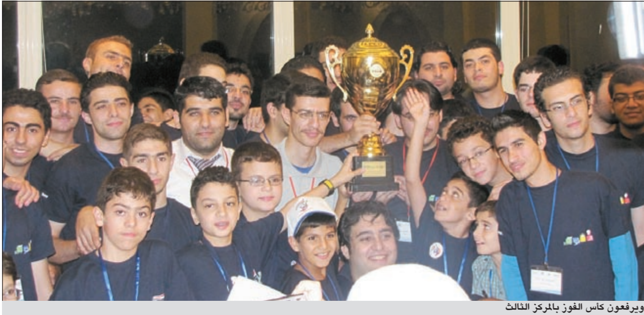
ويرفعون كأس الفوز بالمركز الثالث