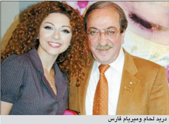
دريد لحام وميريام فارس