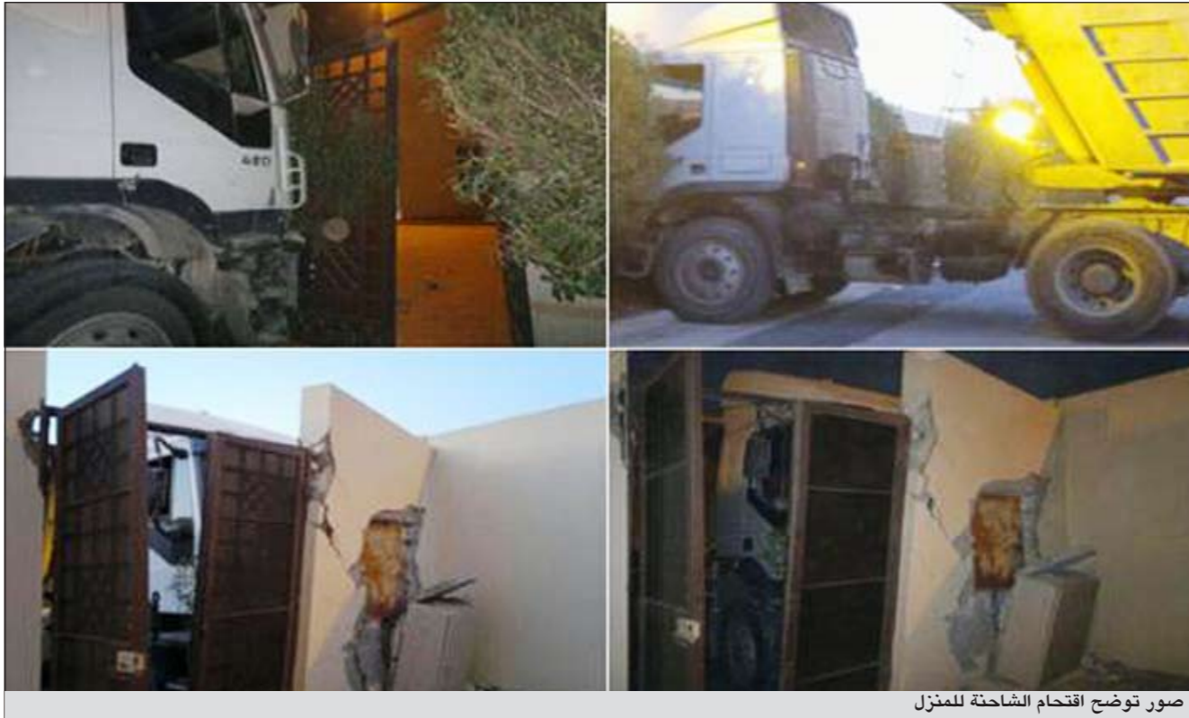
صور توضح اقتحام الشاحنة للمنزل

الشاحنة لم يكن بداخلها سائق، وقت الحادثة، حيث كانت متوقفة في ساحة مسفلتة أمام منزله، ولم تكن كوابحها مؤمنة، ما أدى إلى تحركها وارتطامها بالسور الخارجي لمنزله، فيما حضر بعد ذلك عمال الشركة التي تتبع لها الشاحنة وقدموا له الاعتذار عما حدث.