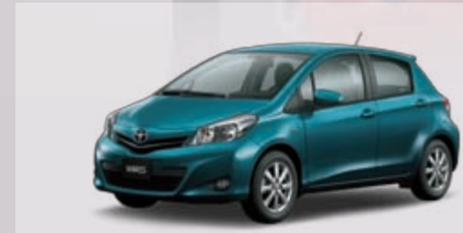
حسب الظروف والأحكام

وأكدت يسرا، بحسب ما ذكر موقع دنيا الوطن، أنها لم تطلب هذا الأجر، وأن اعتذارها عن المسلسل سببه أنه سيقدم في أجزاء عدة، وأنها لا تريد تكرار تلك التجربة خاصة أنها مرتبطة بمسلسل «لحظات حرجة» الذي يقدم في أجزاء أيضاً.