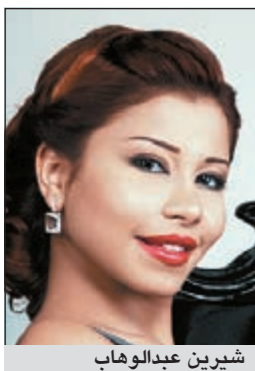
شيرين عبد الوهاب

في التسجيل الذي انتشر عبر اليوتيوب أن «الشعب الإسرائيلي ناس طيبين ما يبشوفوا حاجة بيتأثروا وبيعطوا». ورحبت ضمنياً بأن تصل أغانيها للشعب الإسرائيلي رداً على سؤال: هل تحبين أن تصل أغنياك إلى الشعب الإسرائيلي ويستمعوا لصوتك؟ قائلة: «لو جاوبت العالوسال ده الناس هيزعلوا مني».