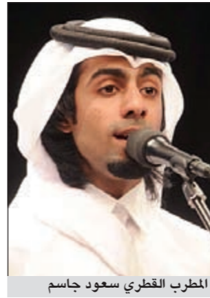
المطرب القطري سعود جاسم