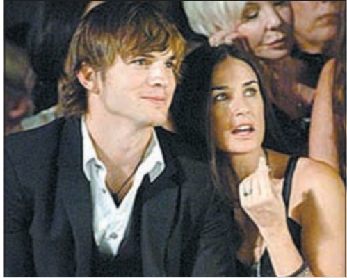
ديمي مور وأستن كاتشر

لوس أنجليس - يوبي.آي: أعلنت الممثلة الأميركية ديمي مور انفصالها عن زوجها الممثل أشتون كاتشر بعد تقارير أشارت إلى خيانتها لها مع فتاة عشرينية، وقالت مور (49 عاماً) في بيان نشره موقع «بيبول» إنه «بحزن كبير قررت إنهاء زواجي من أشتون الذي استمر 6 سنوات».