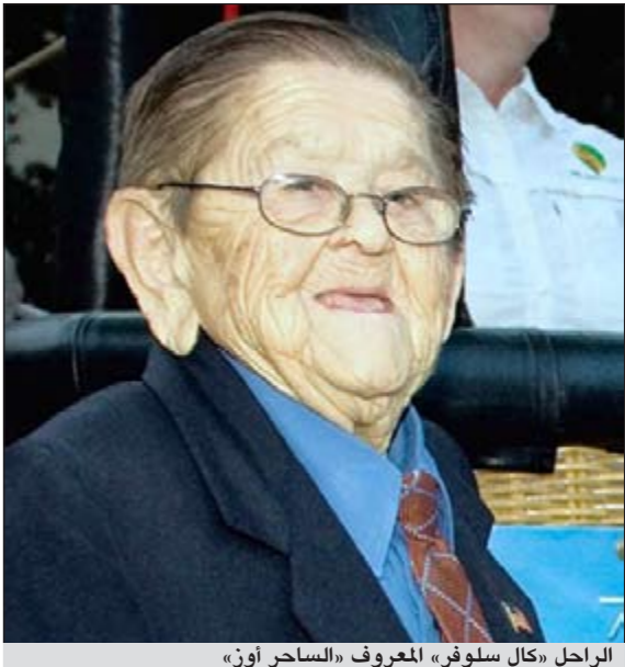
الراحل «كال سلوفو» المعروف «الساحر أوز»

لوس انجليس - أ.ش.أ: توفي الممثل الأميركي «كال سلوفو» عن عمر يناهز 93 عاماً، وهو معروف بأدائه المميز، والذي جسّد دور «الساحر أوز» في فيلم «مونشكين» عام 1939 وهو فيلم كلاسيكي. وسلوفو «الضئيل الجسد» لعب العديد من الأدوار في السينما العالمي وفاز بجائزة الأوسكار وكان عزف بوق. وذكر «جون فريكي» مؤلف كتاب «مائة عام ساحر» ان سلوفو كان عبقريا ومثلا خالدا وفي حقبة الثمانينيات حاز شهرة كبيرة، ووجد جيلا جديدا من المعجبين. يشير إلى أن المثل سلوفو كان ضمن فريق عزف ضعيف المستوى غير أن عزفه كان رائعا. يذكر أنه في عام 2007 جرى تكريمه بأنه الأخير بين سبعة معمرين.