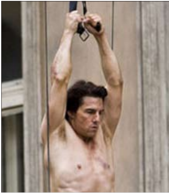
أحد مشاهد فيلم مهمة مستحيلة

دبي - وكالات: تشهد دبي العرض الأول للفيلم السينمائي العالمي الجديد أو «مهمة مستحيلة - بروتوكولات الأشباح» حيث يعرض العمل يوم 7 ديسمبر المقبل في افتتاح فعاليات الدورة الـ 8 لمهرجان دبي السينمائي، أي قبل عرض الفيلم في أميركا بأسبوعين كاملين، وفي الوقت نفسه لم تعلن شركات الإنتاج والتوزيع موعد عرض العمل في مصر حسبما يؤكد موقع imdb الذي أعلن عن خريطة عرض الفيلم بمختلف دول العالم.