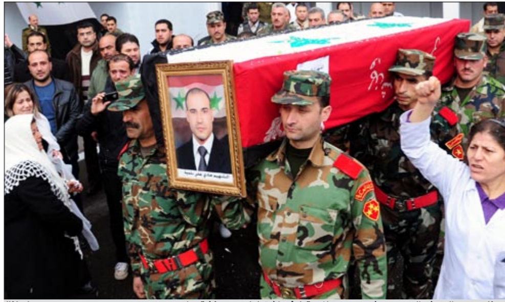
عناصر من الجيش السوري يشيعون زيملا سق في اشتباكات مع متشقين امس (سانا)

الأمهية الحقيقية». وقال وزير الخارجية الروسي سيرغي لافروف خلال مؤتمر صحفي مشترك عقده مع نظيره الهندي صومانهالي كريشنا امس «ان الهجمات التي تعرضت لها مؤسسات الدولة والقوات المسلحة السورية من قبل جماعات مسلحة مؤخرا تذكرنا بالحروب الأهلية».