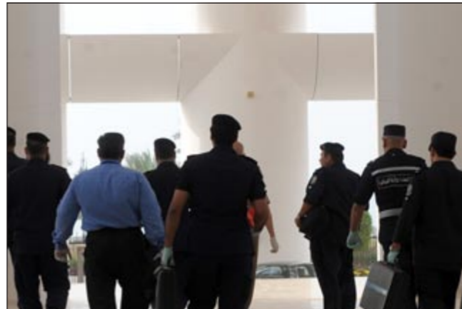
«الأدلة الجنائية» أثناء خروجها من المجلس