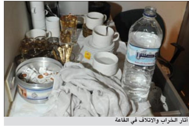
آثار الخراب والاتلاف في القاعة