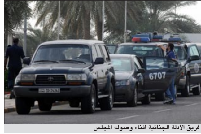
فريق الأدلة الجنائية أثناء وصوله المجلس