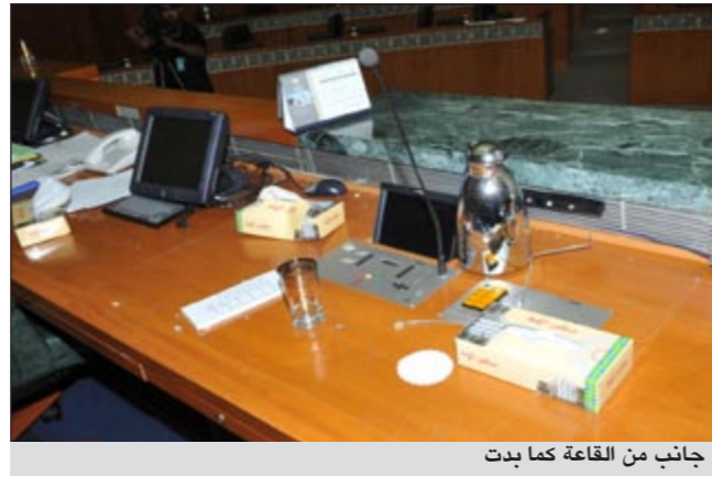
جانب من القاعة كما بدت