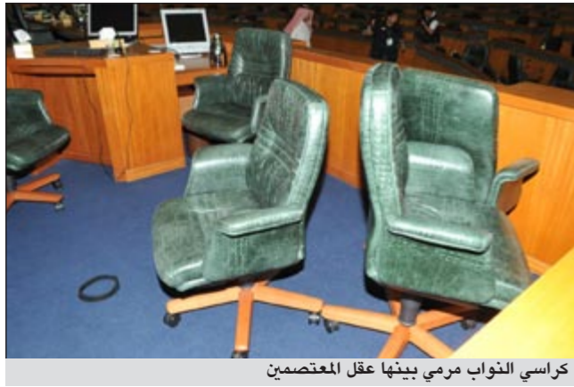
كراسي النواب مرمي ببئنها عقل المعتصمين