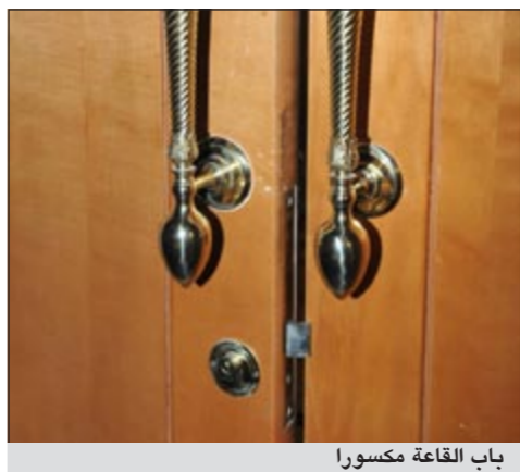
باب القاعة مكسورا