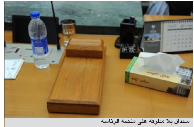
سندان بلا مطرقة على منضدة الرئاسة