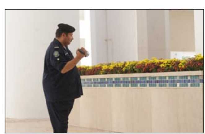
توفيق لإعمال التخريب