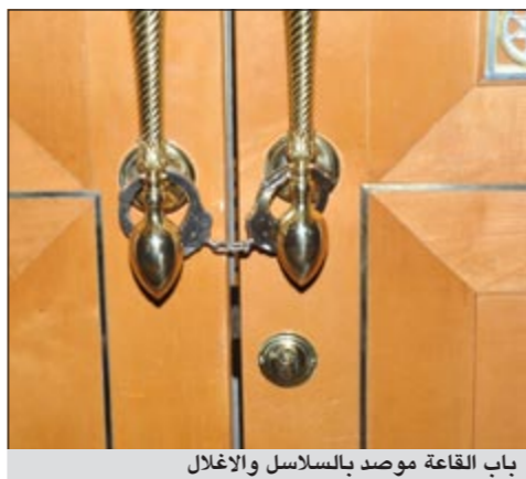
باب القاعة موصد بالسلاسل والأغلال