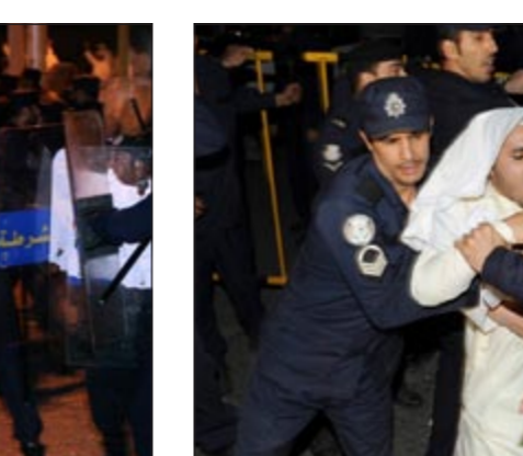
احدى صور المواجهات بين قوات الأمن وأحد المعتصمين مساء أمس الأول

كما اعتبر النائب محمد هايف أن دخول النواب الى قاعة عبدالله السالم كان الهدف منه حماية القاعة، مؤكداً رفضه اقتحام أي مؤسسة حكومية أو شعبية. وقال هايف رداً على سؤال للصحافيين عما إذا كان ما حصل هو ما تريده، لا تؤيد الصدام أو دخول قاعة عبدالله السالم، وإذا كانت هناك اجتهادات من بعض الشباب لعل دخول بعض النواب معهم قد يكون حماية للمجلس، لأنهم لم يتركوهم وحدهم ليخربوا قاعة عبدالله السالم، مشدداً على أننا مبدئياً لا تؤيد اقتحام أي مؤسسة حكومية أو شعبية بهذه الطريقة، وبين هايف أن التعسف الحكومي