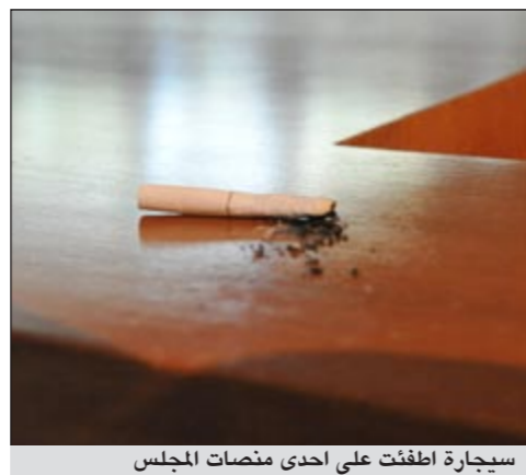
سيجارة أطفئت على إحدى منضدات المجلس

عقد مكتب مجلس الأمة اجتماعاً ظهر أمس الخميس برئاسة رئيس مجلس الأمة جاسم الخرافي وحضور أعضاء المكتب، وقال أمين سر المجلس دعلي العمير في تصريح له عقب الاجتماع إن مكتب المجلس اجتمع اليوم (أمس) اجتماعاً طارئاً على ضوء ما جرى من أحداث مؤسفة ليلة أمس (أمس الأول) من اقتحام مبنى المجلس وقاعة عبدالله السالم وما صاحب ذلك من أعمال تخريب وإصابات نالت بعض أفراد حراس المجلس حيث قرر مكتب المجلس توجيه كتاب إلى نائب رئيس الوزراء ووزير الداخلية يطلب فيه اتخاذ الإجراءات اللازمة وفقاً لأحكام قانوني الجزاء رقمي 16 لسنة 1960، والقوانين المكملة لهما إزاء التعدي على مبنى المجلس ومحتوياته وما لحق بها من اتلاف وتخريب.