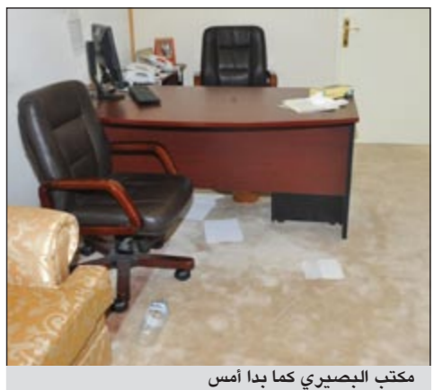
مكتب الجبصري كما بدأ أمس