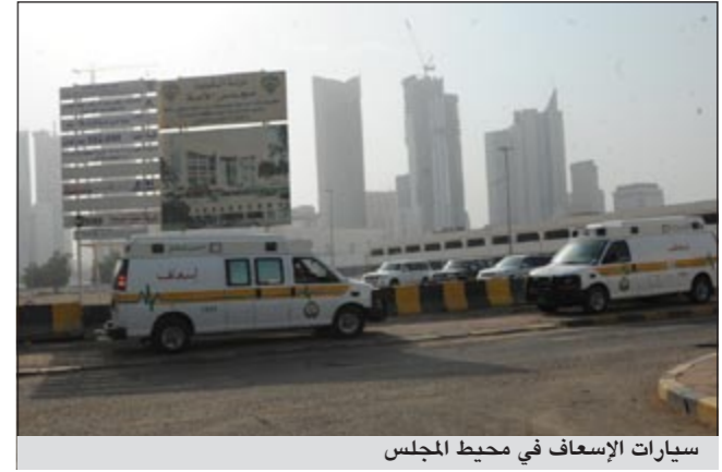
سيارات الإسعاف في محيط المجلس