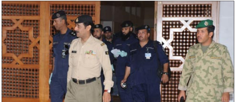
«الأدلة الجنائية» في المجلس