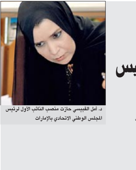
د. أمل القبيسي حازت منصب النائب الأول لرئيس المجلس الوطني الاتحادي بالإمارات

من جهة أخرى، قال مسؤول إيراني رفيع اول من امس ان طهران مستعدة لأشراك الدول المجاورة فيما لديها من تكنولوجيا نووية، ملحاحاً إلى إمكان مساعدة تركيا في بناء محطة للطاقة النووية.