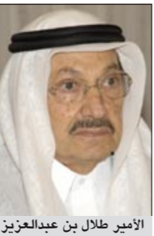
الأمير طلال بن عبدالعزيز

دبي - ي.ب.ي: قدم الأمير طلال بن عبدالعزيز استقالته من هيئة البيعة السعودية التي تعني باختيار الملك ولي العهد في المملكة. وذكر الموقع الإلكتروني للأمير طلال امس أنه رفع قراره إلى العاهل السعودي الملك عبدالله بن عبدالعزيز. ولم يوضح الموقع أسباب الاستقالة من جهة أخرى، أعلن المكتب الإعلامي للأمير طلال بن عبدالعزيز أن الأخير فتح حساباً على الشبكة الإعلامية الاجتماعية «تويتر» امتداداً لحرصه على التواصل مع الرأي العام من منطلق إيمانه بمبدأ «الرأي والرأي الآخر».