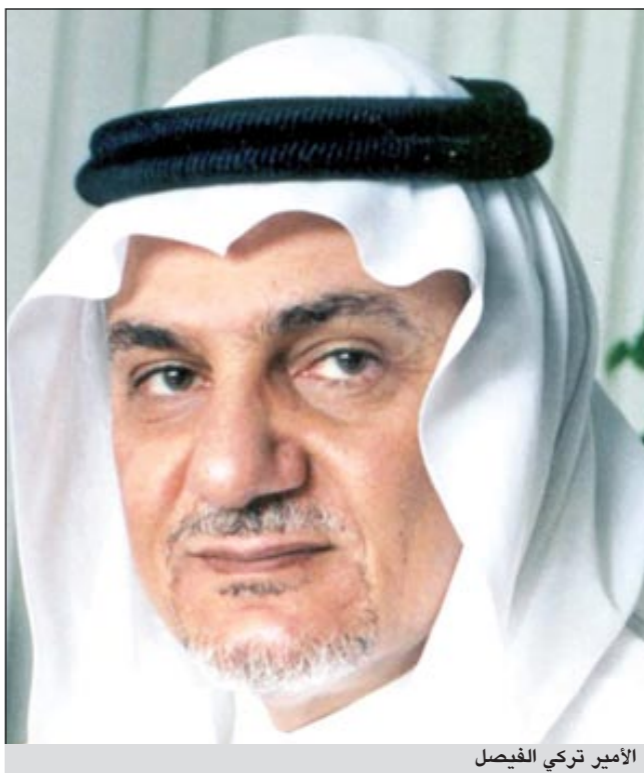
الأمير تركي الفيصل

عواصم- وكالات: حذر الرئيس السابق للاستخبارات السعودية الأمير تركي الفيصل من أن عواقب توجيه ضربة عسكرية إلى إيران ستكون «كارثية»، معتبراً من ناحية أخرى أن تنحي الرئيس السوري بشار الأسد «حتمي».