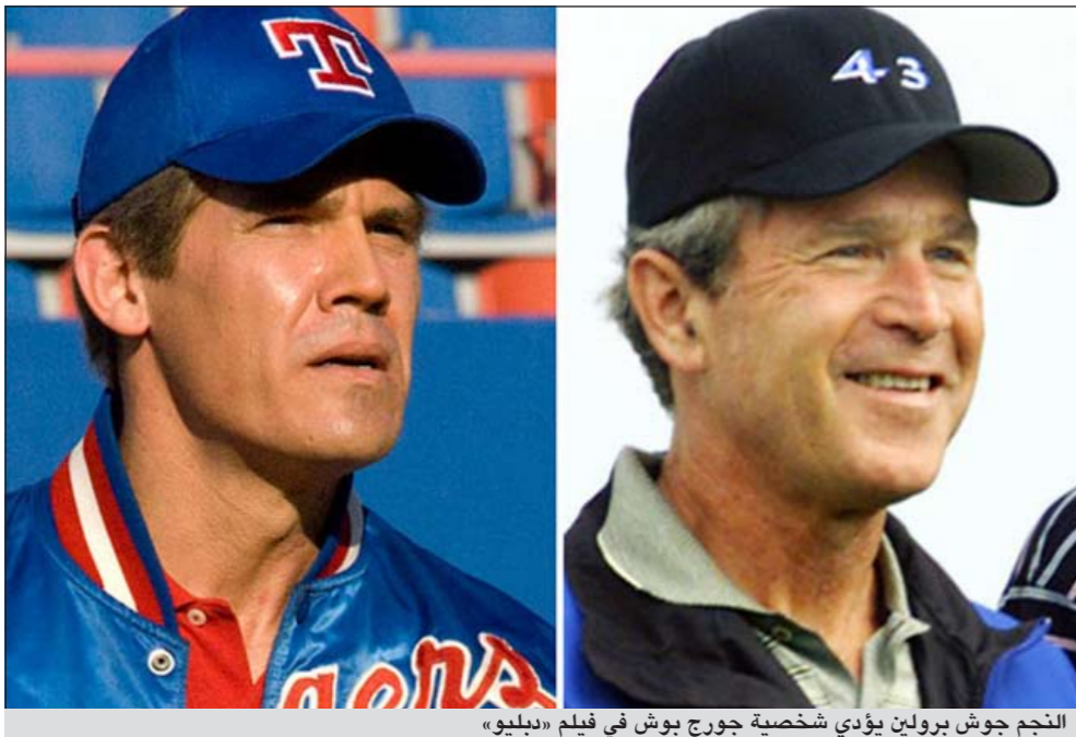
النجم جوش برونين يؤدي شخصية جورج بوش في فيلم «ديليو»

في سياق متصل جمعت صحيفة «ديلي تلغراف» البريطانية صورة لأشهر الممثلين العالميين