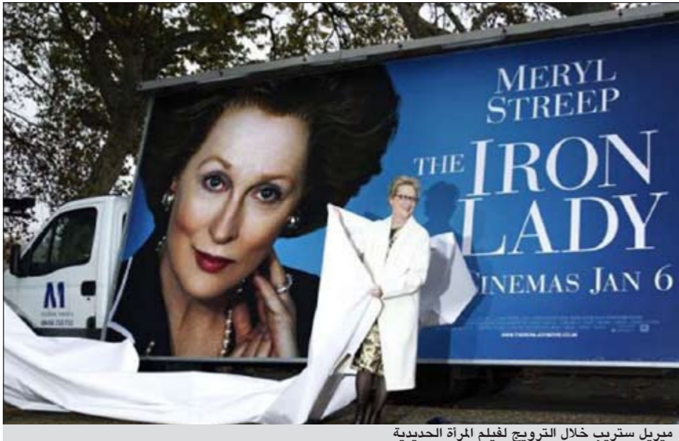
ميريل ستريب خلال الترويج لفيلم المرأة الحديدية

الذين أدوا شخصيات سياسية شهيرة، مثل الملوك والرؤساء أو حتى المعارضين، حيث يتضح من تلك الصور الشبه الكبير الذي يصل إليه الممثل مع الشخصية الحقيقية.