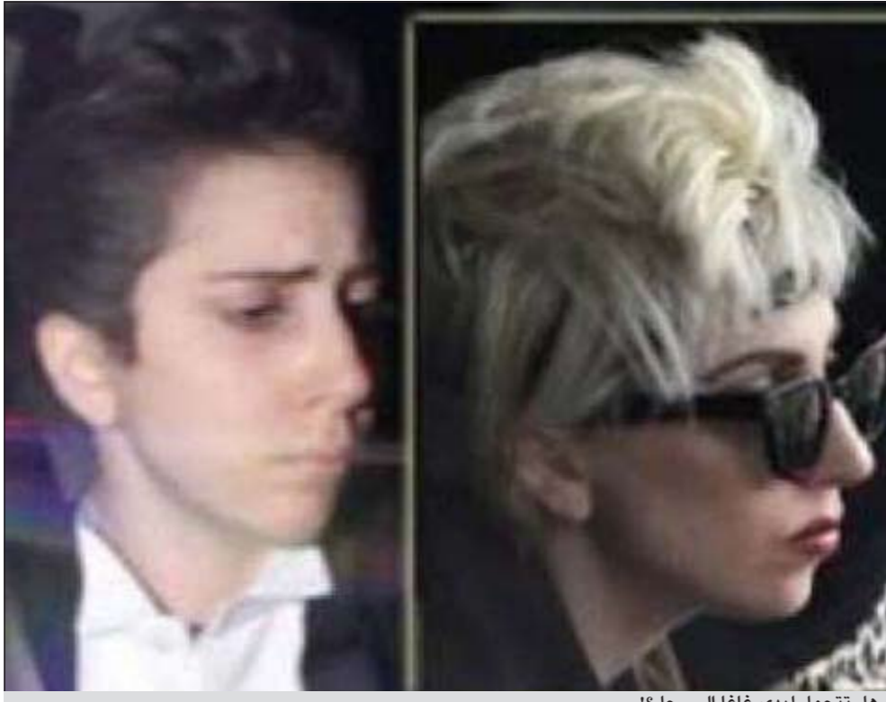
هل تتحول ليدي غاغا إلى رجل؟!

محببها بقصة لم تتعلم بها سابقا، ومن هنا بدأت الترحيبات عن خضوعها لعملية تحول جنسي، خاصة بعد ان اشتهرت ليدي غاغا بصوتها الرخيم الغليظ وملامح وجهها غير النسائي. وكانت قد طالت ليدي غاغا هذه الشائعات من قبل مع بداية انطلاقها ولكنها انكرت الأمر مرارا وتكرارا. كنت قد ظهرت ليدي غاغا مؤخرا في احد فتاوى لندن حيث التفت حولها مصورو البوباراتزي كالعادة.