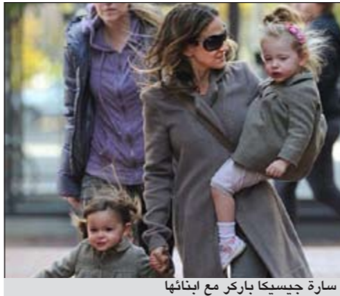
سارة جيسكا باركر مع ابنتها

برلين - د.ب.أ: ذكرت الممثلة الأمريكية الشهيرة سارة جيسكا باركر انها تتجنب الذهاب مع أطفالها إلى المطاعم حتى لا تسبب إزعاجا لباقي رواد المطعم. وقالت باركر (46 عاما) في تصريحات لوكالة الأنباء الألمانية (د.ب.أ) أمس الثلاثاء: «إننا نطبخ كل مساء في المنزل لأننا لا نخرج سوى نادرا حاليا، ربما مرتين شهريا».