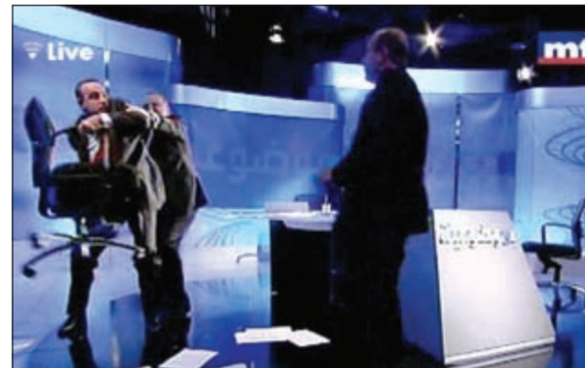
صورة مركبة لمراحل تطور العراك بين الأمين القطري لحزب البعث فايز شكر والقيادي بتيار المستقبل مصطفى علوش خلال برنامج «بموضوعية» على «إم.تي.في»

علوش «كول.. سد بوزك.. شكر يحمل كوب الماء ويضرب به علوش ويقول: «واحد متلك بياكل...». فرد علوش عليه وضربه بكوبه. شكر: يا أخو... فهجم علوش نحو شكر فوق الأخرى وحاول حمل كرسيه وضرب علوش به إلا ان عبود أمسكه من الخلف ومنعه من ذلك ووقف بين الإثنين وهو يقول «شباب روقها..» كما حين كان شكر يقول لعلوش فلما بذبتاً جدا ويقول لعبود «بعاد عنى». وعندما توقف بث البرنامج لمدة نحو 20 دقيقة حين هدأت الأوضاع فقم متابعته، وأخذ اتصال مع أحد الموالين للنظام السوري من دمشق في حين تكلم كل من الضيفين جملة واحدة ولم