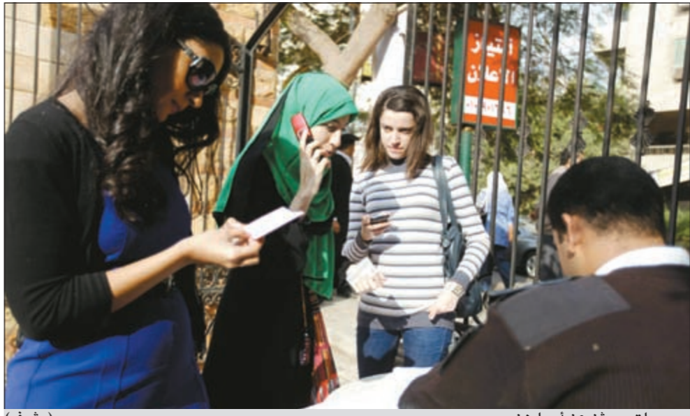
مصريات يبحثن عن أسماءهن (رشيف)

القاهرة - وكالات: صرح الفنان العالمي عمر الشريف في تقارير صحافية ان علاقته بحسني مبارك كانت مثل اي مواطن مصري عادي، ولكن علاقته بسوزان كانت مختلفة تماما خاصة انها كانت حريصة على الاتصال به عندما كانت تزور باريس للخروج وتناول الغداء معها. عمر أكد بحسب ما نقلت مصادر اعلامية ان سوزان مبارك كانت تكلفه بجمع التبرعات من اجل اعمال الخير، ولكنه يشعر بالندم لانه اكتشف بعد ذلك الاساسية للدستور الجديد.