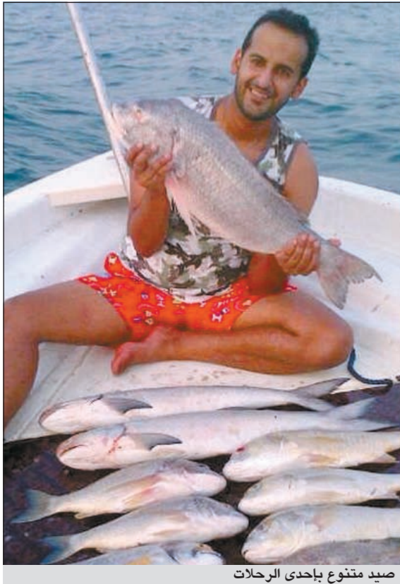
صيد متنوع بإحدى الرحلات