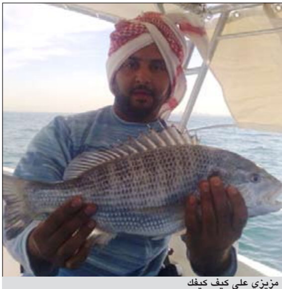
مزيزي على كيف كيف