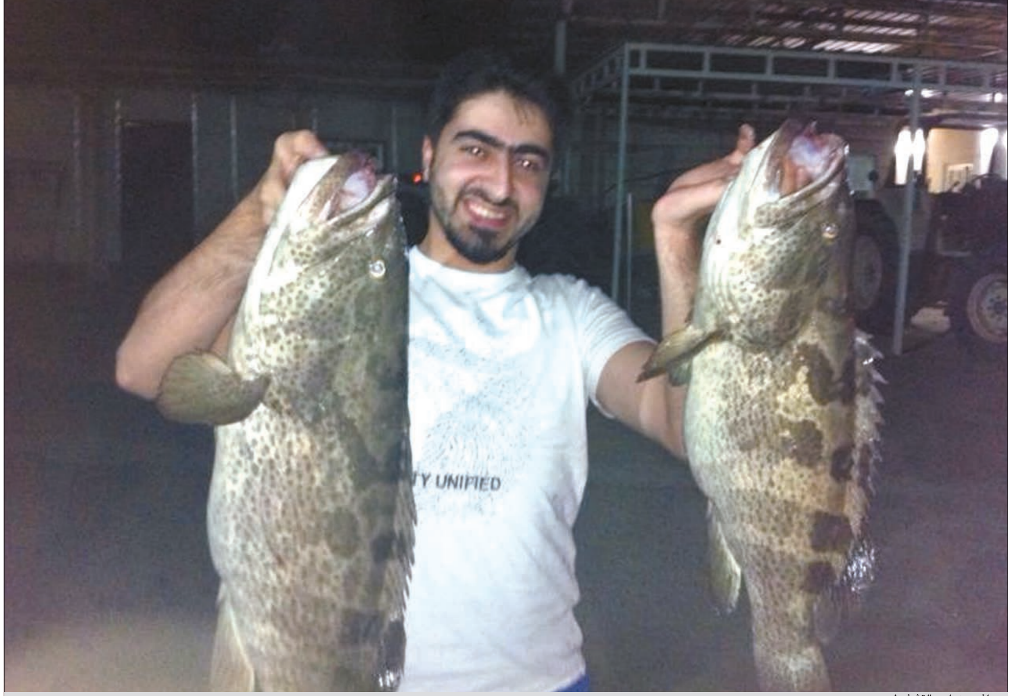
جراغ مع هوامير التشخيظ