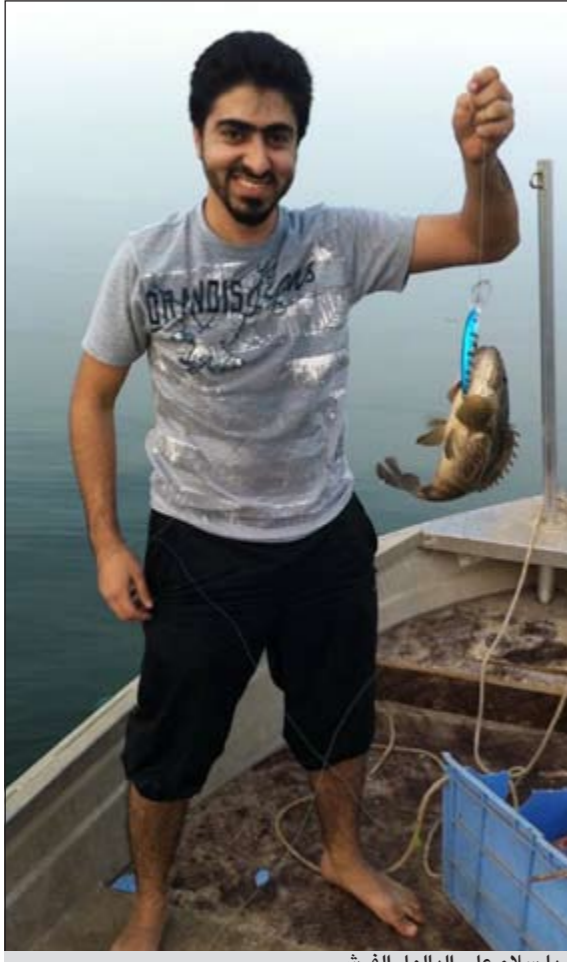
يا سلام على البالول الفرش