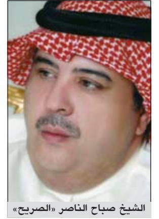
الشيخ صباح الناصر «الصريح»

اما بالنسبة لغياي عن الساحة الفنية والذي طال وكان اكثر من سبع سنوات فلم يكن من فراغ وإنما كان بقناعة تامة لعدم وجود الدعم الكافي والصحيح، لان الفنان يحتاج الى مقومات كثيرة تساعده في طرح اليومه وافكاره. وعن تعاوناته في اليومه، اضاف قائلا: بالفعل كانت مسؤولية صعبة في اختيار الاغاني في الاليوم خاصة بعد هذا الغياب فقد حاولت ان اجعله منوعا بكل ما تحمله الكلمة من معنى سواء على صعيد الكلمات الغنائية أو الاحان وربما يكون نصيب الاسد للشخ صباح الناصر من ناحية الكلمات والدكتور يعقوب من ناحية الاحان وهذا ما جعلني