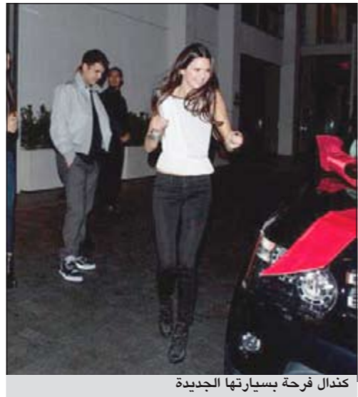
كندال فرحة بسيارتها الجديدة

يو.بي.أي: حصلت كندال جينر شقيقة النجمة الأميركية كيم كارداشيان في عيد ميلادها الـ 16 على هدية لا يمكن لمن في عمرها أن يحلموا بها وهي سيارة «رانج روفر» ثمنها 90 ألف دولار. وأفاد موقع «رادار أونلاين» الأميركي بأن عائلة كارديشيان وجينر اجتمعت في فندق «أنداز» بهوليوود للاحتفال بعيد الفاتحة الـ 16 والذي انتهى بتسليمها هدية عائلتها وهي سيارة من طراز «رانج روفر» ثمنها 90 ألف دولار. وأشارت إلى أن كيم كارديشيان وضعت طلاقها من زوجها كريست هافريز جانباً للاحتفال بعيد ميلاد اختها من والدتها «كريس»، وأشار إلى أن السيارة كانت مركوبة أمام الفندق وعليها شريط أحمر كبيرة وهي موديل العام 2012.