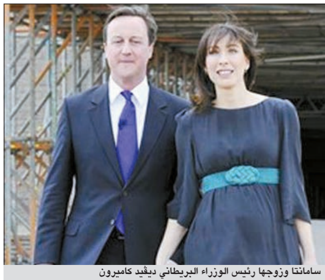
سامانثا وزوجها رئيس الوزراء البريطاني ديفيد كاميرون

تدخل إلى أحد المتاجر حتى لشراء ملابس شخصية وتضع نظارات سوداء سمكية على وجهها لا تلتفت الانتباه إليها على الإطلاق باستثناء مرة واحدة تعرفت عليها بائعة في أحد المتاجر وأصرت أن تلتقط صورة معها.