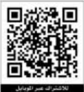
للاشتراك عبر الترميز