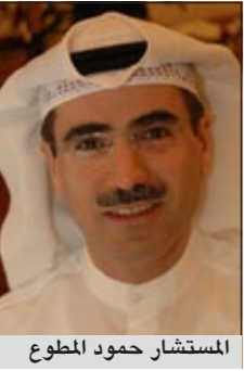
المستشار حمود المطوع