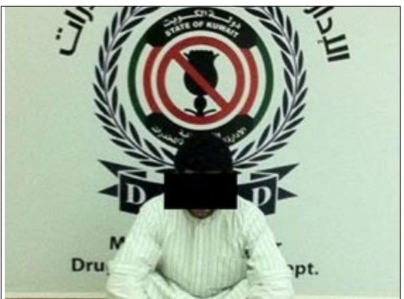
المتهم وامامه المضبوطات

واصلمت الإدارة العامة لمكافحة المخدرات نجاحاتها في مكافحة الجريمة وتعقب المتاجرين بالمخدرات والمسكرات.. حيث تمكن رجال إدارة الكفاح المحلية من ضبط مواطن من أرباب السواقي وعثر بحوزته على 100 غرام من مادة الهيروين المخدرة على هيئة كبسولات وكذلك عدة أكياس بداخل مسكنه وجاخور خاص به. وكانت المعلومات قد وردت إلى الإدارة بتاجر المتهم في المخدرات.. وتم تشكيل قوة للبحث والتحري وبعد التأكد من حيازته للمخدرات تم ضبطه. كما تمكنت إدارة الكفاح المحلية أيضاً من ضبط عصابة مكونة من أربعة أشخاص من جنسية أسوية تقوم بترويج المخدرات داخل البلاد، حيث عثر بحوزتهم على حوالي 40 غراماً من مادة الأيس المخدرة، وقد اعترفوا بعملية الترويج وأنهم يقومون بجلب تلك المخدرات من موطنهم. هذا وقد تمت إحالة المتهم والعصابة الأسوية والمضبوطات الخاصة بكل منهما إلى نيابة المخدرات والخمر حيث الاختصاص.