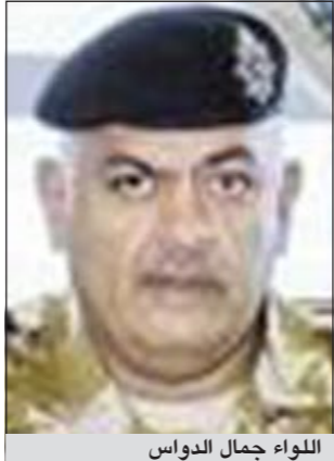
اللواء جمال الدوايس