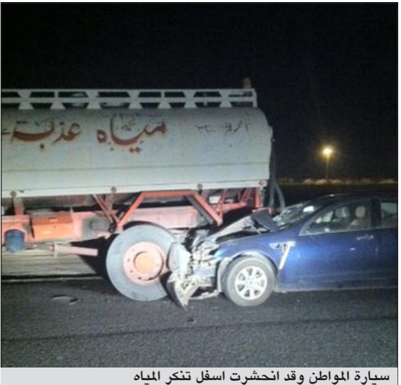
سيارة المواطن وقد انحشرت أسفل تنكر المياه

نجا مواطن من الموت المحقق حينما اصطدمت مركبته بتتكر مياه عند مدخل إسطبلات الجهراء. وقد أكد المواطن في التحقيقات التي أجريت معه أن سبب الحادث واصطدامه بالتتكر حسب زعمه يعود إلى عدم وجود إنارة خلفية في التتكر. وفي التفاصيل التي يرويها مصدر أمني أن بلاغا ورد مساء أمس عن حادث تصادم من أحد المارة لينتج رجال الأمن إلى موقع البلاغ حيث تبين أن تتكر المياه الذي اصطدم به مواطن تعطل إظاره الأمامي لبتكره من أجل إصلاحه في الصباح إلا أن قائد الأمامية اصطدم به وعليه سجلت قضية. ● هاني الظفيري