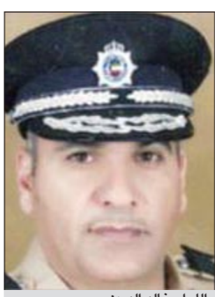
اللواء خالد الدين