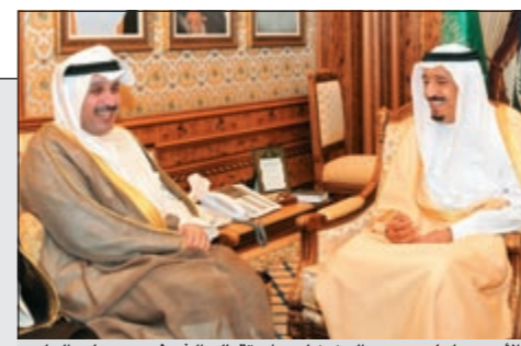
الأمير سلمان بن عبدالعزيز لدى استقباله الشيخ حمد جابر العلي

سفيرا بالرياض نقل تهنئة القيادة السياسية للأمير سلمان بتعيينه وزيراً للدفاع: الشعب الكويتي على يقين بتمتع سموه بمكانة عالية ورفيعة 04