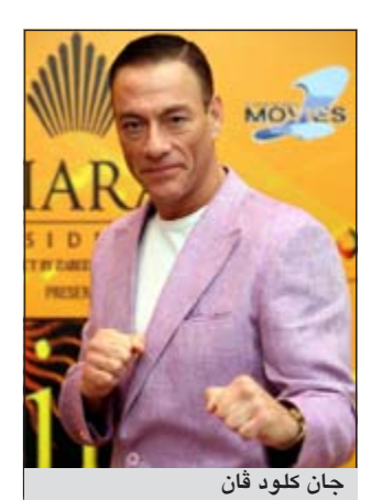
جان كلود فان

إلا ان: توصل العلماء الى عمار من شأنه تقديم الحل لأولئك الذين يجاهدون بشتى السبل للتخلص من السمعة الزائدة بلا طائل، ويتأتى هذا في شكل حقنة يومية تفضي الى التخلص من قرابة نصف شحوم الجسد في فترة 4 اسابيع فقط. ويبدو أن أعلام الملايين من الناس في طريقها لرؤية النور بتوصل العلماء الى عمار من شأنه التصدي بفعالية للسمعة، فقد أثبتت التجارب أن حقنة يومية منه كفيلة بالتخلص من نحو 40% من شحوم الجسد وخاصة فحم الكرش بعد انقضاء شهر واحد، وقال علماء أميركيون بجامعة تكساس - في ورقة نشرها على صفحات صحيفة «ساينس ترانسليشن ميديسين» - إنهم أجروا تجاربهم بهذا الشأن على مجموعة من القرد، وإن العقار المسمى «اديبوتايد» أثبت نجاحه وسطها. وأضافوا قولهم إنهم متفائلون إزاء أنه سيحدث الأثر نفسه وسط البشر. ويذكر أن عقارين كان قد سمح باستخدامهما في السنوات الأخيرة - بإرشادات الطبيب فقط لأنهما يعلمان على الدماغ - سحبا وحظرا بسبب المخاوف من أعراضهما الجانبية، لكن فريق العلماء الأميركي الذي يقف وراء هذا عقار «اديبوتايد» يقولون إن تركيبته مأمونة لأنها