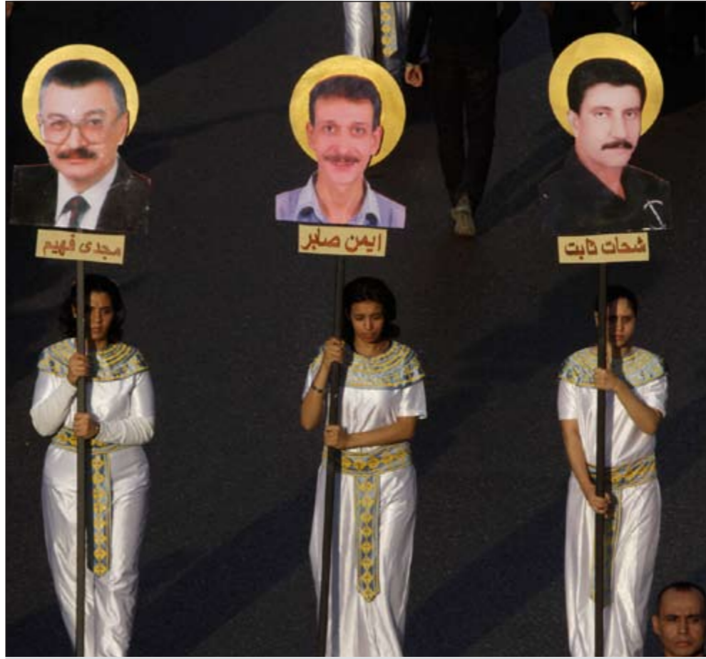
قطبيات يرفعن صور بعض ضحايا ماسبيرو خلال مسيرة حداد في القاهرة أمس (أ.ف.ب)

وقال المستشار عبد المعز في تصريحات لوكالة أنباء الشرق الأوسط بباريس أمس إن قرار حق تصويت المصريين في الخارج لم تلعب عليه أي جهة باعتباره «حق لهم» على الرغم من وجود بعض الصعوبات العملية التي تتمثل في عدم ملائمة العديد من القنصليات والسفارات والبعثات الدبلوماسية المصرية في الخارج