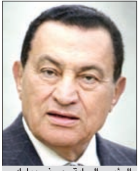
الرئيس السابق حسني مبارك

وأوضح أن اللجنة العليا تبحث حالياً عن بدائل للتصويت