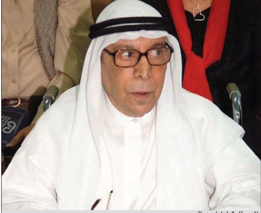
الموسيقار الراحل أحمد باقر