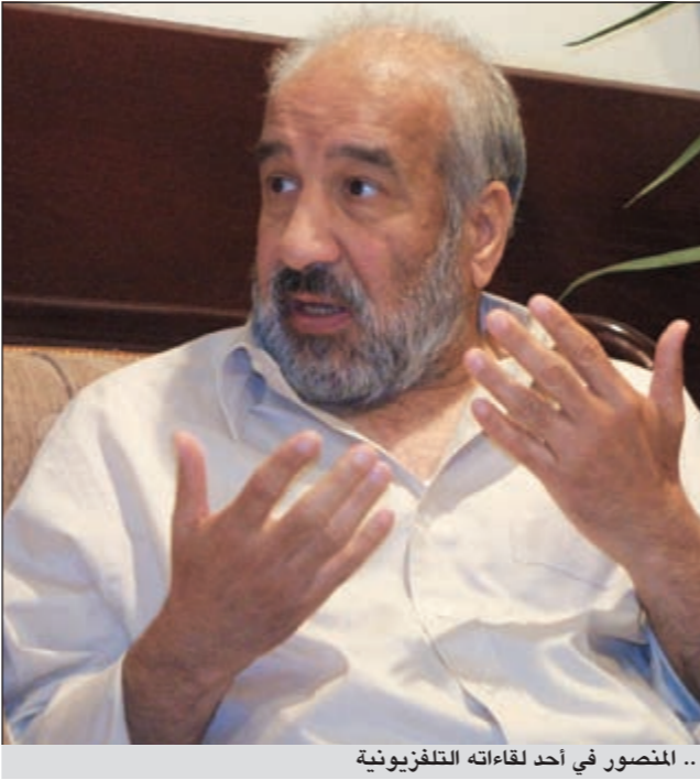
.. المنصور في أحد لقاءاته التلفزيونية