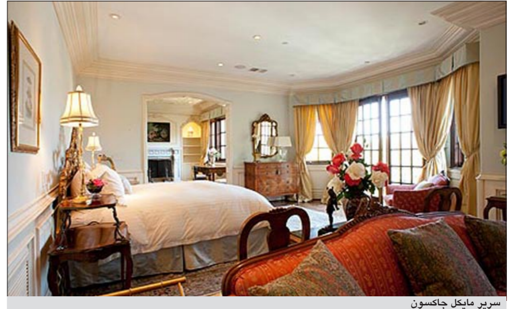
سرير مايكل جاكسون

لوس أنجيليس - د.ب.أ: أعلنت إحدى صالات المزادات الأربعاء أنه سيتم عرض بعض محتويات المنزل الذي توفي فيه ملك البوب مايكل جاكسون في شهر يونيو عام 2009 للبيع في مزاد ومن بينها السرير الذي لفظ عليه أنفاسه الأخيرة. وقالت صالة جوليان في بيفرلي هيلز أنها ستبيع هذه المحتويات في السابع عشر من الشهر المقبل، ومنعت عائلة جاكسون صالة المزادات من استخدام اسم المغني عند البيع، وكان جاكسون يقيم في منزل مستأجر في لوس أنجيليس عندما توفي. وأعلن عن المنزل الذي يضم 7 حجرات نوم، ورقمه 100 بشوارع نورث كارولود في منطقة هوليوود هيلز