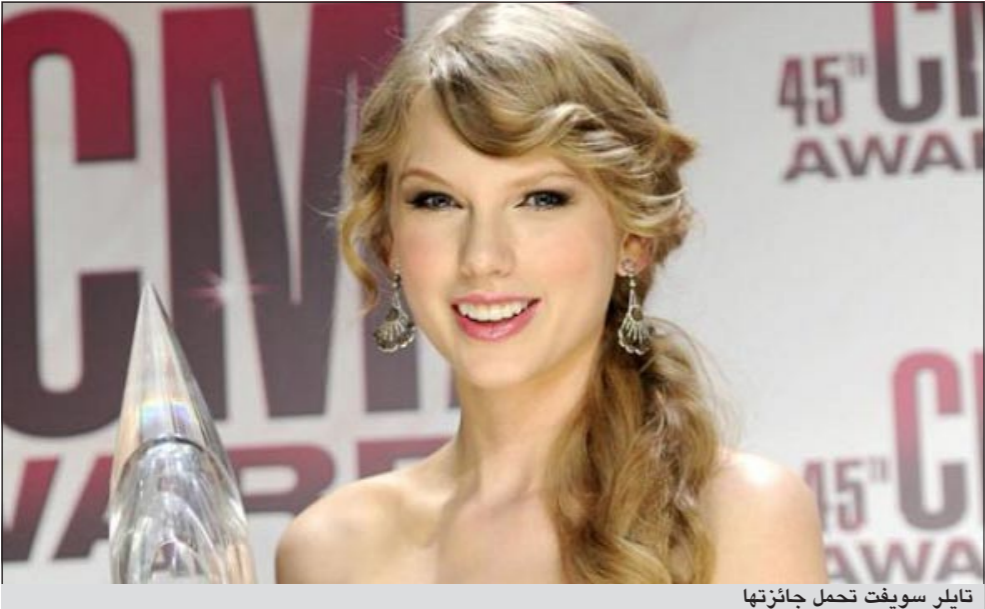
تايلر سويفت تحمل جائزتها

ناشيفيل - يو.بي.أي: كرمت النجمة الأميركية تايلر سويفت بمنحها لقب «مغنية العام» بالحفل الذي أقامته الأربعاء الماضي رابطة موسيقى الريف الأميركية في مدينة ناشفيل. واختار القيمين على الحفل سويفت (20 عاما) للحصول على لقب مغنية العام بعد أن كانت حملت اللقب أيضا عام 2009