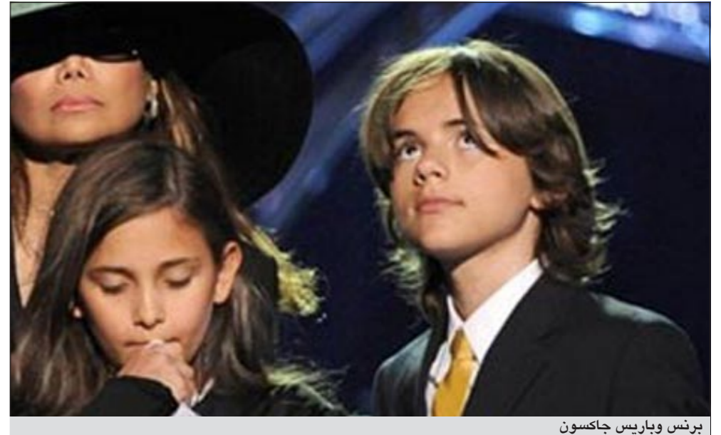
برنس وباريس جاكسون

لوس أنجيليس - أ.ش.أ: في الوقت الذي كانت لاتزال فيه المحكمة تنظر في قضية مصرع ملك البوب مايكل جاكسون المتهم فيها طبيبه الخاص كورنراد موراي، أصبح أبناء جاكسون الثلاثة لا يبالون بمتابعة إجراءات المحاكمة، حتى إنهم ذهبوا إلى السينما لمشاهدة فيلم «سرقة برج» في وقت كانت المحكمة تنظر فيه تفاصيل دقيقة في القضية.