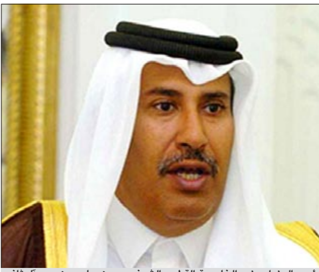
رئيس الوزراء وزير الخارجية القطري الشيخ حمد بن جاسم بن جبر آل ثاني

وعن الأوضاع في بلاده، قال: «ليس لدينا مسجونون سياسيون ومنظمات حقوق الإنسان تجوب كل السجون.. وهناك تقدم كبير في التعليم والصحة وفي كيفية تنمية المجتمع»، معتبرا أن زيادة مرتبات موظفي الدولة من القطريين «نوع من توزيع الثروة»، وليس ما يقال عن أنه قرار استقبائي ضد أي احتجاجات أو توترات اجتماعية».