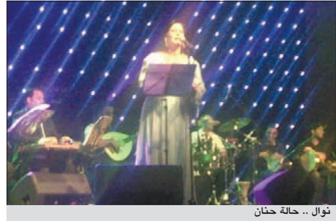
نوال .. حالة حنان

في الكويت، حيث غنى «طلع عاشق» و«خلوني» و«فرحة حماسة» بالإضافة الى أغنية عراقية «بعد ما ريك انطاك».