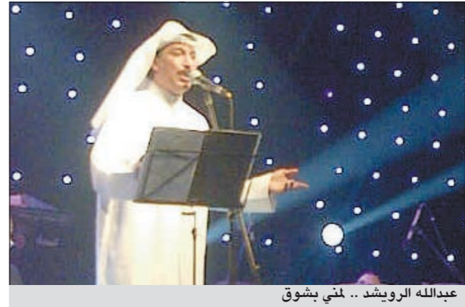
عبدالله الرويشد .. لمني بشوق