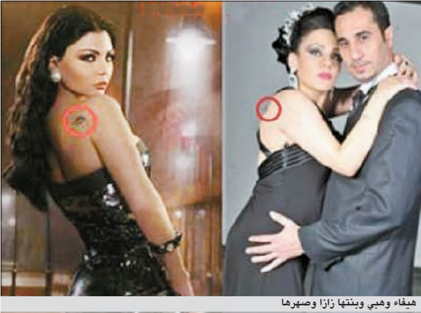
هيفاء وهبي وبناتها زازا وصهرها

ومكياجها وشعرها الذي تنافس به فتيات العشرينيات. ومن المعروف ان هيفاء وهبي كانت متزوجة من قبل سنوات وهي صغيرة وأنجبت طفلتها زينب، وكلما يأتي اسمها في اي لقاء تلفزيوني تجهش هيفاء وهبي بالكآء. يذكر ان هيفاء وهبي متزوجة من رجل الأعمال المصري احمد ابوهشيمة، ودائما ما تلقى زينب انتقادات واسعة بسبب فارق السن الواضح بينهما.