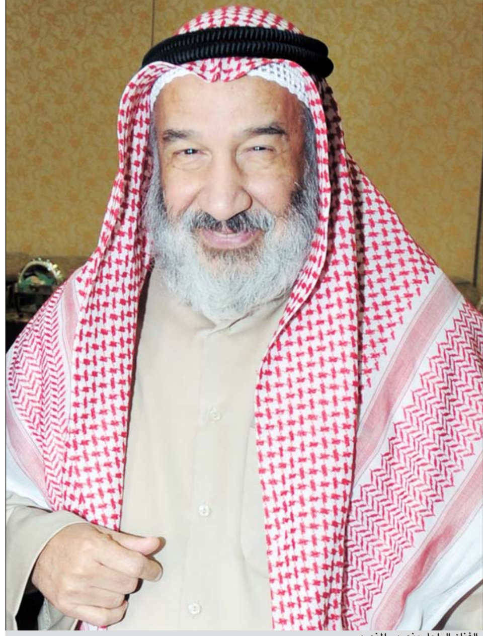
الفنان الراحل منصور المنصور