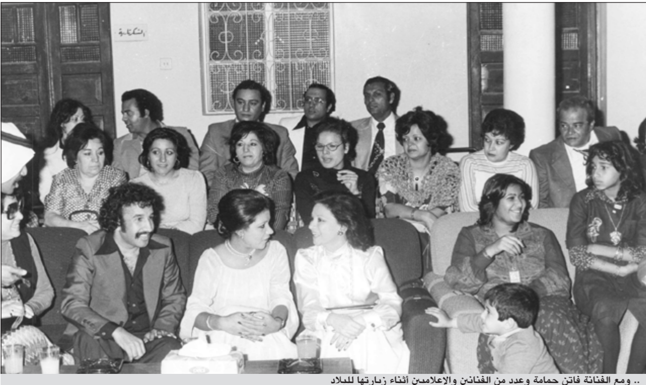
.. ومع الفنانة فانت حمامة وعدد من الفنانين والإعلاميين أثناء زيارتها للبلاد