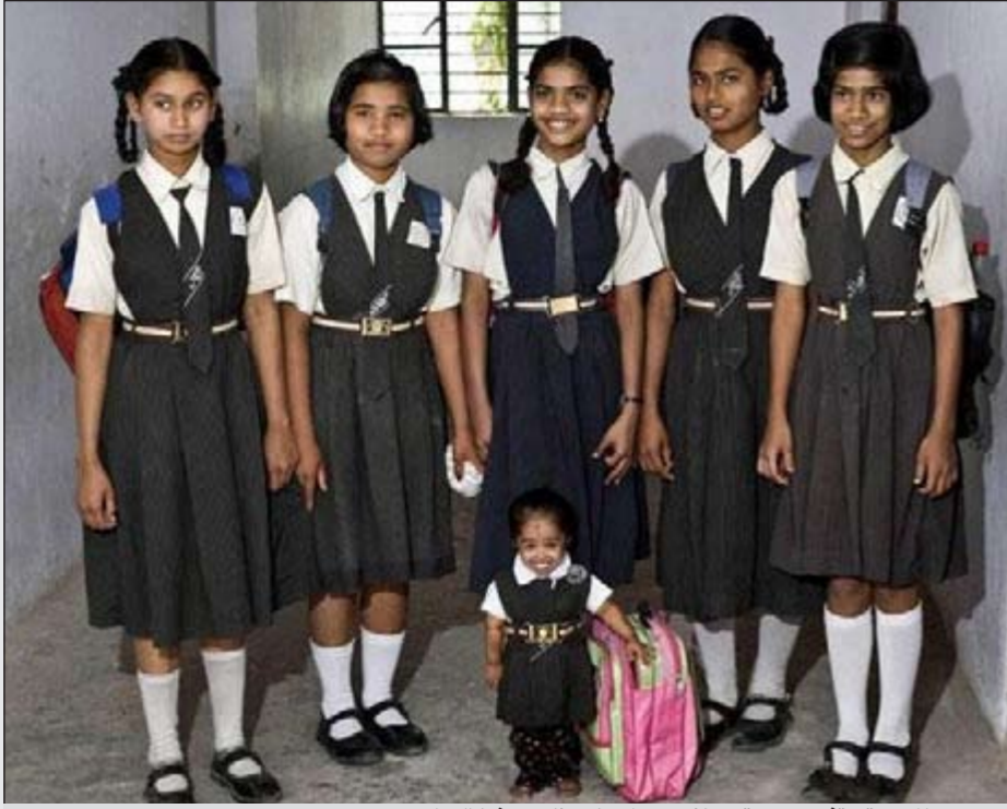
..وبزى المدرسة تقف مبتسمة بجانب زميلاتها وبنات صفها الدراسي