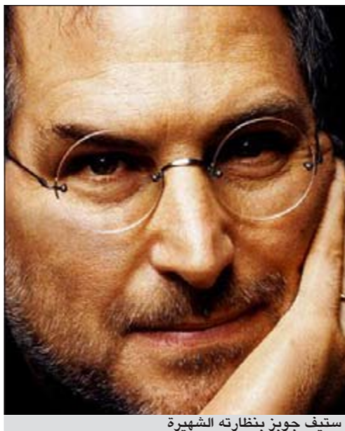
ستيف جوبز بنظارته الشهيرة

برلين - د.ب.أ: أعلنت شركة «لنور» الألمانية للنظارات أن مبيعاتها من الموديل الذي يطلق عليه «ريمس»، أي بلا أطارات للعدسات، وهو بأعلى المثل الذي كان يرتديه ستيف جوبز، مؤسس شركة آبل ارتفعت بعد وفاة الرجل. يذكر أن جوبز بدأ في وضع النظارات «ريمس» موديل لنور كلاسيك روند منذ 14 عاما بعدما اكتشفها في نيويورك وظل موافيا على استبدال نظارته بنفس الموديل. وقالت شركة لنور بقرها في مدينة أنتجستيت، جنوب غربي ألمانيا، إنها باعت 147 نظارة فقط من هذا الموديل العام الماضي لكنها باعت 150 نظارة من الموديل ذاته منذ نهاية سبتمبر، ولديها حاليا قائمة انتظار تضم 131 اسما.