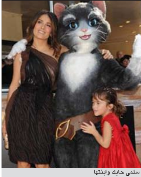
سلمي حايك وابنتها

كشفت الممثلة العالمية اللبنانية الأصل سلمى حايك عن أنها تقوم بمحاولات دائمة مع بعض الخدع أحيانا وذلك كي تجبر ابنتها الصغيرة على تناول الخضراوات. وأوضحت حايك (45 عاما) أنها تعمل على تمويه بعض أصناف الخضراوات ضمن الطعام الذي تحبه ابنتها لأنها تعتقد أنه من الضروري أن تتناول الطفلة البالغة 4 سنوات هذه الخضراوات. وأضافت حايك أن إصرارها على ذلك يرجع لأن الخضار في هذه المرحلة العمرية من حياتها يعتبر الأكثر فائدة للأطفال، لذلك فهي تلجأ إلى استخدام جميع المهارات الممكنة أمامها كي تخفي الخضراوات بين الطعام الذي تريده الطفلة كي تتأكد من أنها ستتناولها مع الطعام بهذه الطريقة، لأن الطفلة لن ترغب في تناول الخضراوات نهائيا في الأحوال العادية.