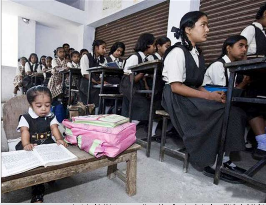
الفتاة الهندية الأصغر في العالم على مقعد خاص يناسب حجمها داخل الفصل الدراسي

برلين - د.ب.أ: أعلنت شركة «لنور» الألمانية للنظارات أن مبيعاتها من الموديل الذي يطلق عليه «ريمس»، أي بلا أطارات للعدسات، وهو بأعلى المثل الذي كان يرتديه ستيف جوبز، مؤسس شركة آبل ارتفعت بعد وفاة الرجل. يذكر أن جوبز بدأ في وضع النظارات «ريمس» موديل لنور كلاسيك روند منذ 14 عاما بعدما اكتشفها في نيويورك وظل موافيا على استبدال نظارته بنفس الموديل. وقالت شركة لنور بقرها في مدينة أنتجستيت، جنوب غربي ألمانيا، إنها باعت 147 نظارة فقط من هذا الموديل العام الماضي لكنها باعت 150 نظارة من الموديل ذاته منذ نهاية سبتمبر، ولديها حاليا قائمة انتظار تضم 131 اسما.