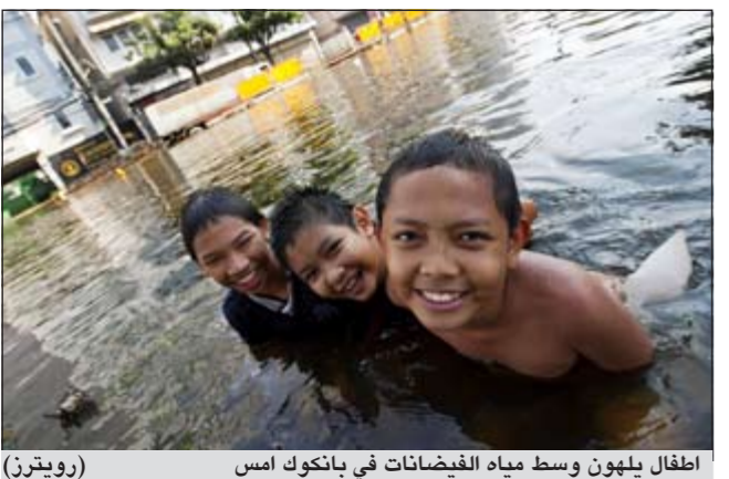
اطفال يلعبون وسط مياه الفيضانات في بانكوك امس

وأصدرت السلطات التايلندية أوامر بإخلاء ثمانين منطقة في حين لا تزال سبع مناطق أخرى تحت المراقبة ما أجبر حوالي 11 ألف شخص على اللجوء إلى مراكز الإيواء. ونقلت وسائل اعلام تايلندية صورا ومشاهد حية لحاصرة مياه الفيضانات منطقتين صناعيتين شرق العاصمة ومنطقة تجارية وسطها كما أوضحت مشاهد أخرى عرقلة حركة السير والنقل العام بسبب تدفق المياه داخل