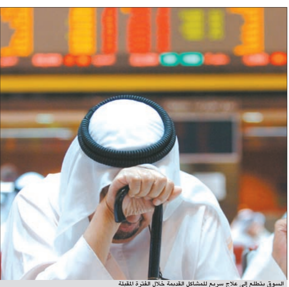
السوق يتطلع إلى علاج سريع للمشاكل القديمة خلال الفترة المقبلة

دبي - رويترز: تتطلع طيران الإمارات لسوق التمويل الإسلامي الأكثر مرونة من أجل تمويل مشترياتها من الطائرات مع اعتماد البنوك الدولية عن صفقات الطائرات بسبب أزمة ديون منطقة اليورو. وقال رئيس «طيران الإمارات» تيم كلارك لـ «رويترز» أن البنوك الأوروبية وخاصة الفرنسية التي كانت من كبار ممولي صفقات طيران الإمارات مع إيرباص وبوينغ تميل الآن للزحف عن المجازفة بسبب الأزمة. وأضاف كلارك «نخطط بشكل ما للحصول على تمويل من بنوك أوروبية، ولكن الأمر أصعب بعض الشيء الآن. لا يزال بإمكاننا اللجوء لسوق التمويل الإسلامي كما أن خيارات التمويل الأخرى مفتوحة أمامنا دائما». وأضاف أن إصدار صكوك «ليس أمرا مستبعدا».