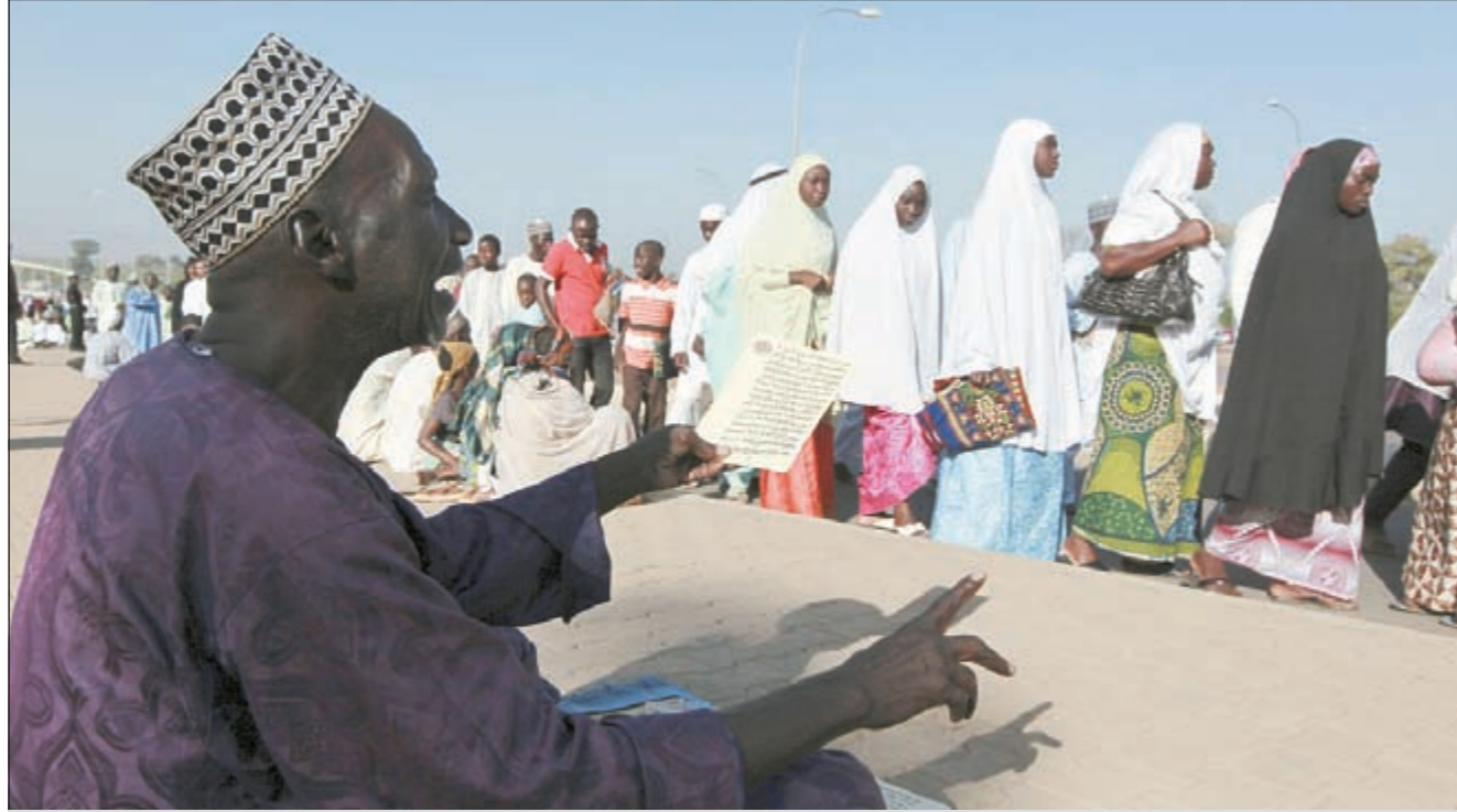
داعية نيجيرية يقرأ الأذعية خلال الاحتفال بعيد الأضحى المبارك أمس

ونقلت صحيفة (ذت نيشن) النيجيرية الصادرة صباح أمس عن الجمعية قولها «إن الإهداء هو نوع من المساعدة الرمزية للفقراء الذين لا يستطيعون شراء أغراض العيد». وقامت الجمعية المسيحية بتسليم المساعدات إلى جمعية