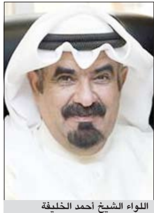
اللواء الشيخ أحمد الخليفة