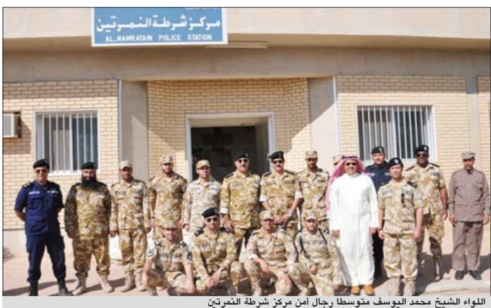
اللواء الشيخ محمد اليوسف متوسلاً رجال أمن مركز شرطة السميرتين

حيث زار مركز ام سديرة والصخيري وجميع المراكز التابعة لقطاع الرقعة.