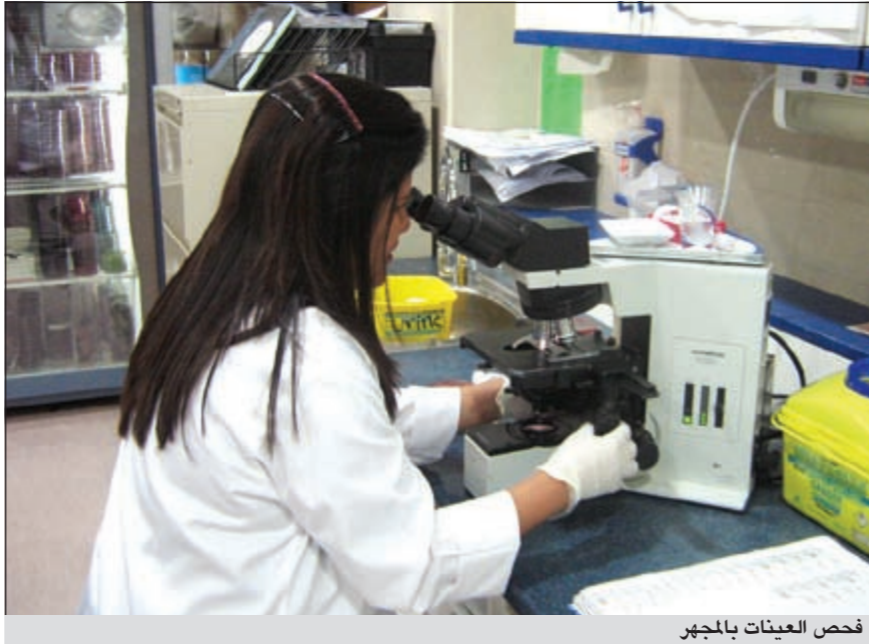
فحص العينات بالمجهر