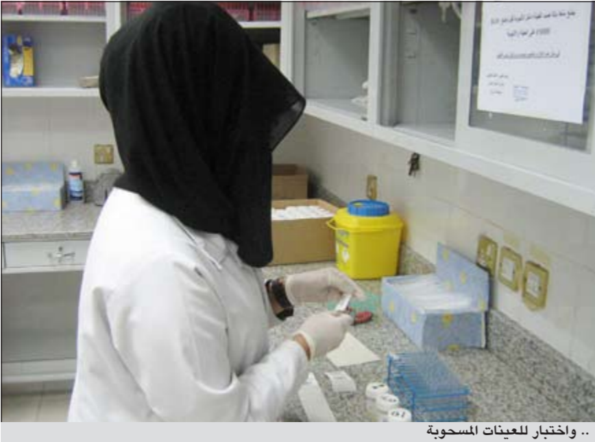
.. واختبار للعينات المسحوبة