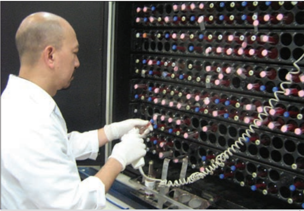
فحص العينات المزروعة

مطالب وهموم الإسراع بالكادر طالب فنيو المختبرات من وزارة الصحة بالإسراع مع ديوان الخدمة المدنية لإقرار الكوادر المالية، والنظر إلى مهنة المختبرات نظرة إنسانية، بالإضافة إلى تنظيم قانون الخفارات من الناحية الاجتماعية والقيمة المالية لاستمرار البذل والعطاء في هذه المهنة المشرفة. مشاكل كثيرة أكد فنيو المختبرات أن مشاكل المهنة لا تعد ولا تحصى، وخطورتها على الفنيين أكثر من نفعها لهم، وذلك لأنهم معرضون للإصابة بالعديد من الأمراض المعدية والخطيرة. هيكلية معتمدة طالب العاملون في مجال المختبرات الطبية بوضع هيكلية معتمدة يتم من خلالها إنصاف جميع العاملين في مجال المختبرات، بالإضافة إلى عمل دورات وبرامج للفنيين لتطويرهم مهنيا.