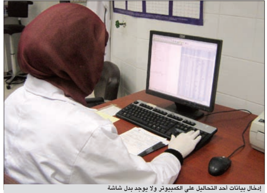
إدخال بيانات أحد التحاليل على الكمبيوتر ولا يوجد بدل شاشة